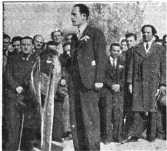
Bolgarski pevci na turneji po Sloveniji. Slika jih prikazuje na grobu slovenskih skladateljev

je ta teden »rešil« dve važni vprašanji, rešil seveda po svoje. Ob tej priliki je imela javnost priliko videti, kaj je prav za prav diplomacija in kako visoko stoji morala v politiki. In še nekaj. Male države so se lahko do kraja prepričale, da je vse govoričenje o enakosti pustolovska potegavščina, ki ni vredna niti besede. Evropa je z obravnavanjem abesinskega in španskega vprašanja v svetu Društva narodov z brez-