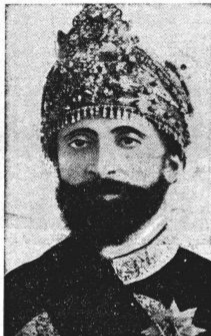
Haile Selasie, cesar brez cesarstva

»Kar se tiče razgovorov s Francijo, ki so v teku, naj bom previden. Ne vem, ali bomo dospeli do kakega zaključka, to pa tudi zaradi tega, ker leži po sredi izredno aktualen problem, namreč španska vojna, v kateri si stojimo nasproti. Oni žele, da bi zmagala Barcelona, mi pa hočemo Francovo zmago.«