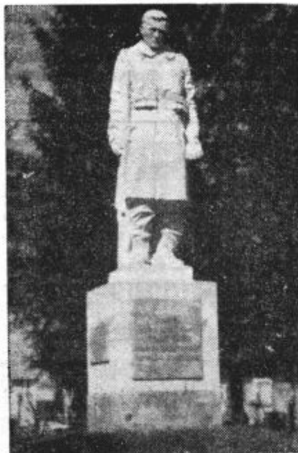
Spomenik slovenskim žrtvam za našo svobodo pri Sv. Križu

Kdo bi bil pred dvajsetimi leti mogel slutiti, v kakšnem boleznem položaju bo Evropa trepetala leta 1938.! Takrat so naši fantje, polni vere in zaupanja v slovansko bodočnost javno in uporno vrgli s sebe avstrijski jarem in so še sredi avstrijskih vezi začeli v Judenburgu ponosno in neustrašeno vzklikati — Jugoslaviji. Zgodilo se je — kakor že tolikokrat, da je preprosti človek prehitel nje, ki naj bi ga vodili, in sam z odločno kretnjo stopil v vrtinec dogodkov ter vsemu svetu izpovedal svojo nezlomljivo voljo, svojo zahtevo po svobodi.