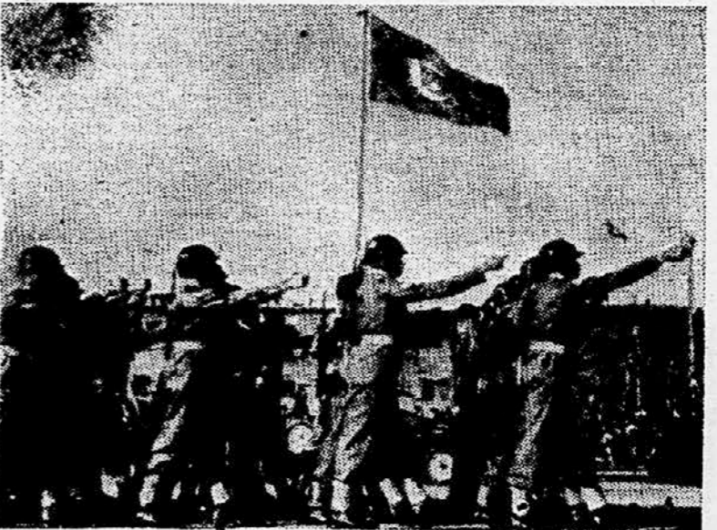
Nova egiptovska armada