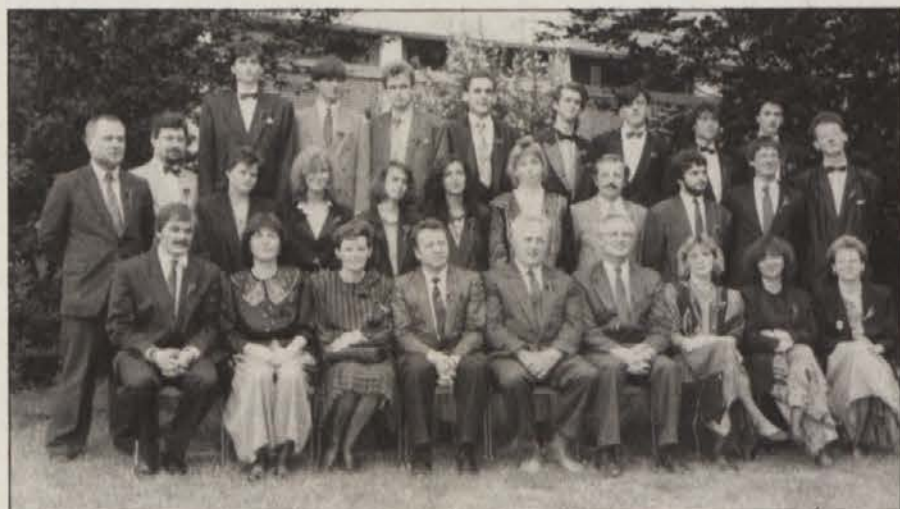
Veselijo se zaključka: maturantje 8.a...

Skupno s kandidati, ki so kot zamudniki opravili zrelostne izpite, je doslej od leta 1963, ko je bila 1. matura na slovenski gimnaziji, to ustanovo zaključilo 1067 dijakov in dijakinj.