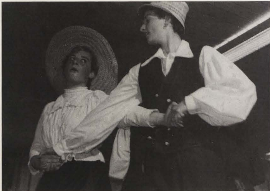
Po končanem delu so se terice in fantje poveselili. Ženinovo snubljenje nevesta na šaljiv način zavrne.