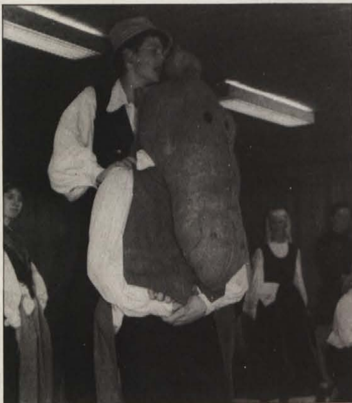
Konj, ki ga „martrata“ kovač in šintar.

Z „Babjo hojsetjo“ smo videli folklorni prikaz brez kičastih primesi. Mladim plesalcem in plesalkam ter vsem sodelujočim, ki so na pristen način oživili in prikazali pomemben del naš ljudske kulture, enkratne ljudske plesne, ki ta čas nimajo para na Koroškem, pa je treba iskreno čestitati.