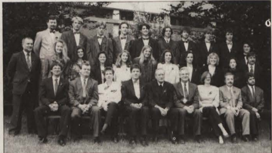
... in 8.b razreda s profesorji vred.