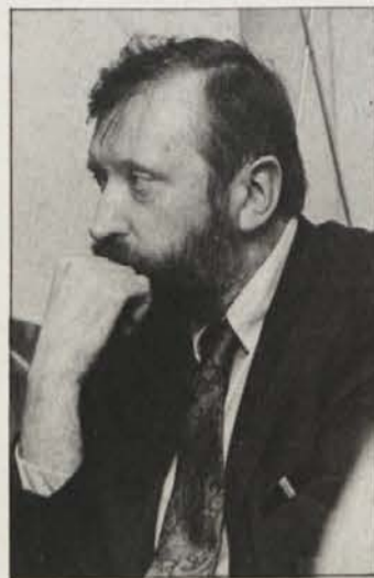
Zunanji minister dr. Dimitrij Rupel