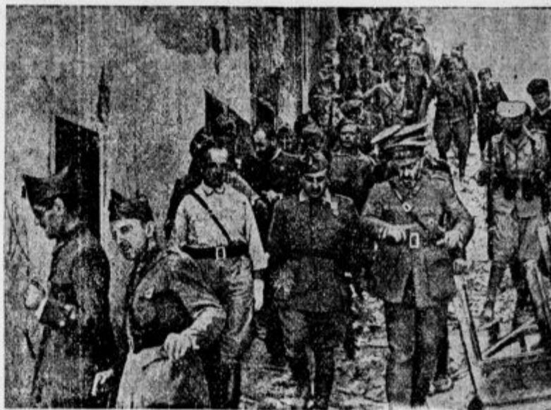
Po dvamesečnem odporu proti rdeči premoči so hrabri branilci Alkazarja, rešeni od nacionalnih čet, zapustili popolnoma porušen zgodovinski grad Fi lipa II. Na čelu vrhovni poveljnik belih čet general Franco s poveljnikom hrabrih branilcev polkovnikom Mescardom.