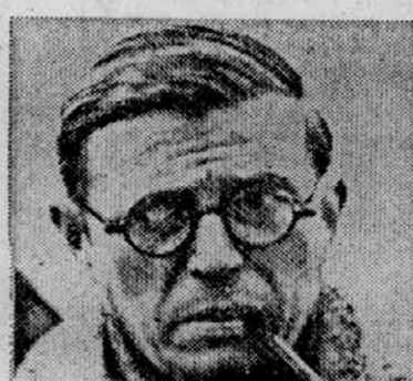
J. P. SARTRE