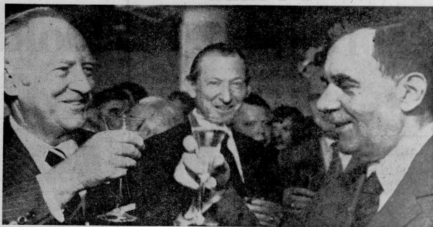
ROGERS, WALDHEIM IN GROMIKO NA ZACETKU EVROPSKE KONFERENCE V HELSINKIH

KPSZ in sovjetska država sta se ravnali in se bosta vedno ravnali po načelih leninistične mednarodne politike ter tako zagotavljali najugodnejše možnosti za gradnjo komunizma v naši deželi, za nove uspehe bratskih socialističnih dežel ter naprednih in miroljubnih sil po vsem svetu.