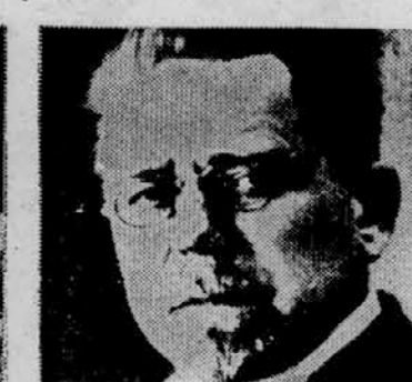
W. S. REYMONT