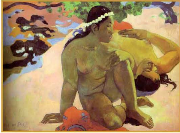
Paul Gauguin, Aha oe tei? (Si ljubosumen?), olje na platno, 1892

spoštujemo na vseh treh ravneh, tudi na telesni. Prišli smo do občutka sramu - ta ne temelji na zaničevanju telesa, ampak želi poudariti, zaščititi njegovo vrednost in dostojanstvo. Že res, da sta naša prastarša "bila naga in ju ni bilo sram" (1 Mz 2,25), a sta se po tem, ko sta se Bogu uprla, zavedla, da sta naga in se oblekla, ker ju je bilo sram (1 Mz 3,7). Pa ne zato, ker bi njuno telo naenkrat postalo slabo, ampak ker se je sprevrgel