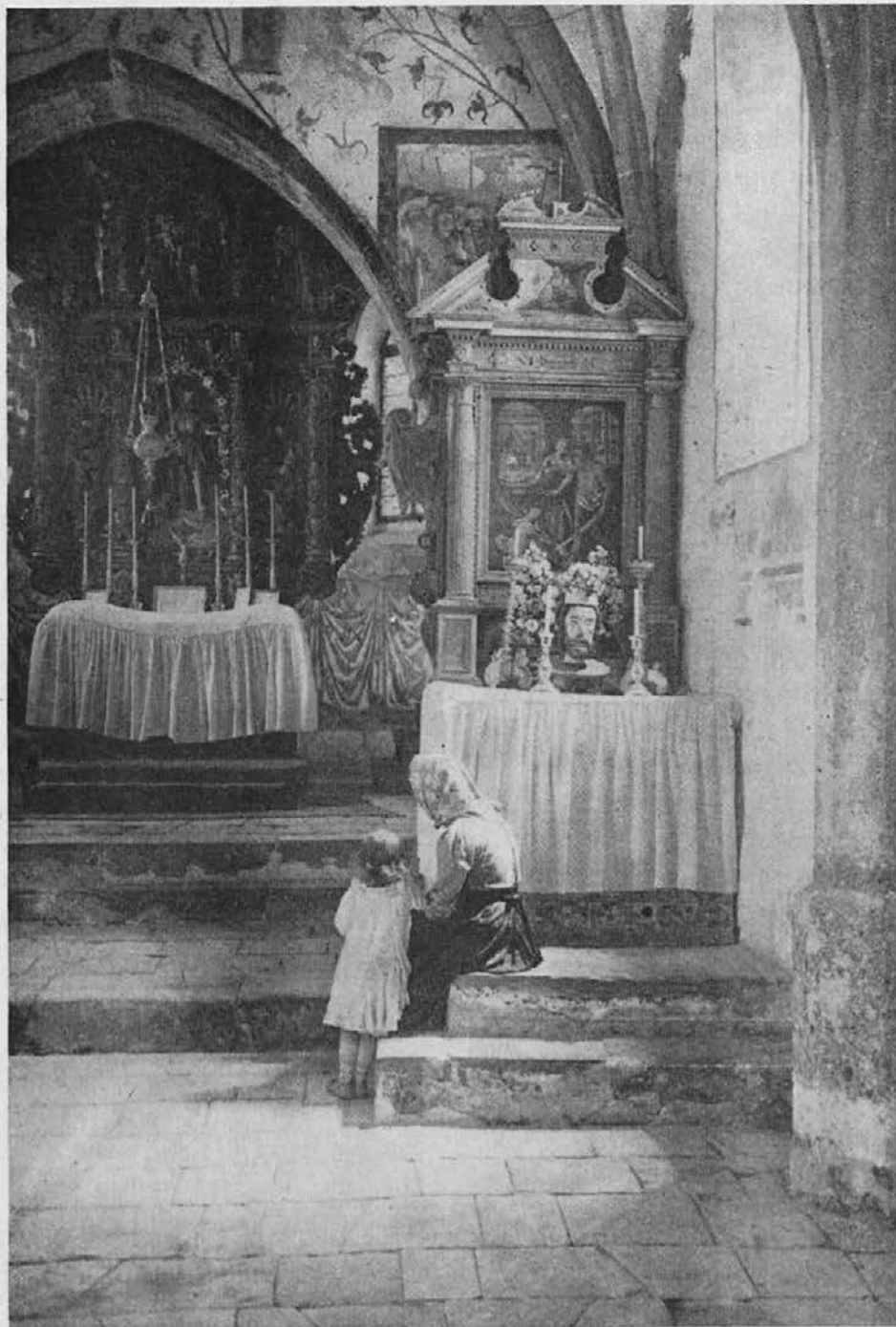
Ena slik med mnogimi slikami Koledarja iz Slovenske domovine. V spominih na domovino najdemo utehe premnogokdaj. Naroči si Slovanski Koledar za leto 1945. V njem boš našel morda sliko svojega kraja.