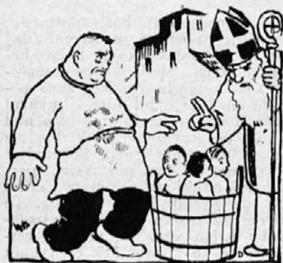
Vse tri fantiče je obudil k življenju.

tedaj pa je šel tam mimo sv. Miklavž; spoznal je nedolžno kri treh fantičev, presenetil zverinskega mesarja in vpričo njega, ki jih je bil razsekal in hotel prodajati kot meso, k življenju obudil otroke. Ta zgodba je čisto resnična, saj je nekaj podobnega zapisal celo sv. Bonaventura. Ta pripoveduje o dveh pridnih dijakih, ki sta potovala okrog in se nekega dne ustavila tudi pri nekem krčmarju v mestu Myra. Gostilničarja je zamikal njun denar in ponoči je oba dijaka v spanju zaklal. Ker ni vedel, kam naj skrije njih trupla, ju je razsekal in poslal v mesnico, da bi ju tam prodali. Pa krčmar je delal račun brez sv. Miklavža. Isto zločinstvo in isto čudežno oživljenje se je dogodilo