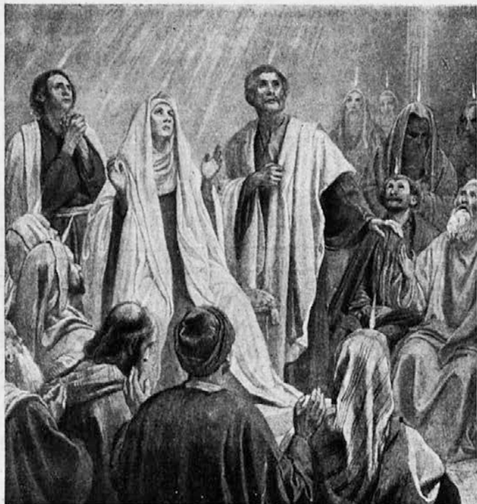
Nevesta Svetega Duha na binkoštni praznik.

kala po svetu do konca dni, ki bo zmivala grehe ljudi in njihove duše zalivala, da bodo rodile lepe in obilne kreposti. Njen Jezus je na zemlji ustanovil novo božje kraljestvo, ta Sveti Duh, ki danes prihaja, pa bo kraljevske božje otroke razsvetljeval, osrčeval in vodil, da bodo podobno kakor on znali ljubiti in trpeti.