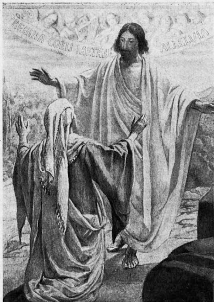
Pred Marijo je zažarel Jezus v nebeški svetlobi.

zgodaj zjutraj. In kakor je učencema, idočima v Emavs, razlagal potrebo svojega trpljenja, tako je tudi Mariji povedal: »Kristus je vse to moral trpeti in tretji dan vstati.«