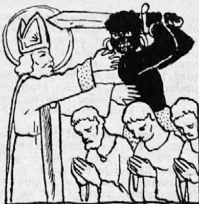
Trem trgovcem je rešil življenje.

V ječi pa so se generali domislili svetniškega nadškofa iz Myre. Kaj bi ne mogel tudi njim pomagati, kot onim trem trgovcem, ko so bili takrat v podobni stiski? Pa kaj bi upali nanj, so žalostno razmišljali, kako naj pride o pravem času sem iz svoje daljne dežele? Že ob zori jih bodo usmrtili. Vso noč so premislili. Zatekali so se k Bogu in k njegovemu služabniku Nikolaju, po katerem je naklonil že toliko čudežev. In svetnik jih je uslišal. V spanju se je prikazal cesarju in še posebej njegovemu prvemu mi-