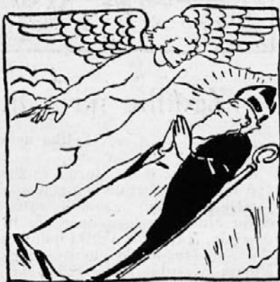
Njegova svetniška duša je odplavala v nebo.

L. 1087. so trgovci iz majhnega jadranskega ribiškega mesta Barija svetnikovo telo oteli pred Turki. Trgovci iz Benetk pa kar niso bili zadovoljni s tem. Pa je zmagal Bari. Še danes časte v veličastni baziliki tega mesta svetniške relikvije. Pa tudi v mestu »Sv. Miklavž v Pristanu« blizu Nancya jih imajo nekaj. Svetnik ima svoje cerkve po vsej zemlji. Šestnajst sto let je že poteklo od njegove smrti, pa ljudje še niso pozabili patrona mornarjev, študentov, žrtev ognja in po nedolžnem obsojenih, sploh vseh, ki jim prete nevarnost, revščina in nesreče.