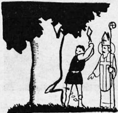
Po sedmem udarcu se je orjak zrušil.

tedaj pa je šel tam mimo sv. Miklavž; spoznal je nedolžno kri treh fantičev, presenetil zverinskega mesarja in vpričo njega, ki jih je bil razsekal in hotel prodajati kot meso, k življenju obudil otroke. Ta zgodba je čisto resnična, saj je nekaj podobnega zapisal celo sv. Bonaventura. Ta pripoveduje o dveh pridnih dijakih, ki sta potovala okrog in se nekega dne ustavila tudi pri nekem krčmarju v mestu Myra. Gostilničarja je zamikal njun denar in ponoči je oba dijaka v spanju zaklal. Ker ni vedel, kam naj skrije njih trupla, ju je razsekal in poslal v mesnico, da bi ju tam prodali. Pa krčmar je delal račun brez sv. Miklavža. Isto zločinstvo in isto čudežno oživljenje se je dogodilo