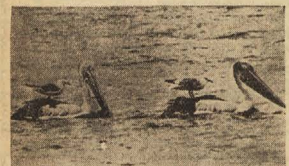
Kratek počitek na dolgi poti

Novozelanec sir Edmund Hillary, zmagovalec najvišje gore sveta, bo vodil novozelandsko odpravo v Antarktiko. Antarktično področje namerava prehoditi po dolgem in počez.