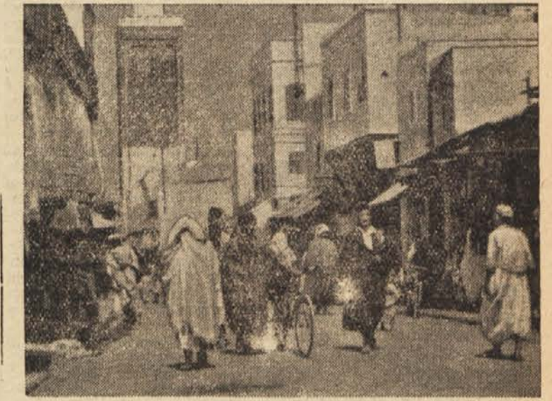
Ulica v Rabatu, središču francoske uprave v Maroku

Večina v težavnih razmerah živečih prebivalcev odpade na južne kraje. Tako je od 1.357.000 v bedi ži-