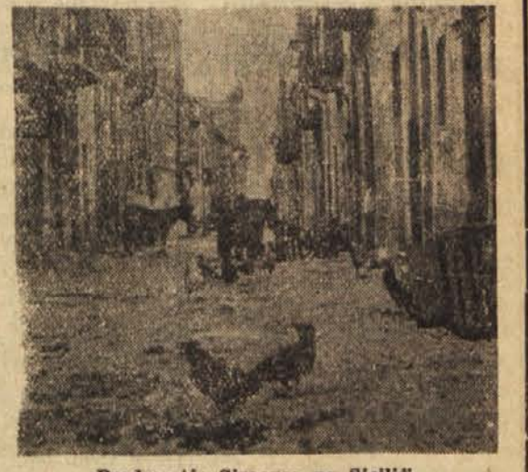
Predmestje Siracuse na Siciliji