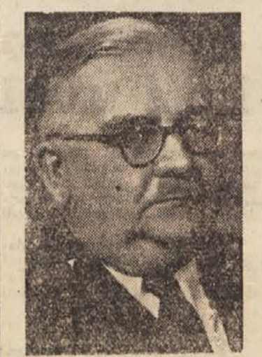
inženir je bil zaposlen pri »Elinu« v Weisu pri Gradcu, dalje v Budimpešti, v tovarni »Ganz«, kjer

Njegova blesteca kariera se je pričela že zelo zgodaj. Kot mlad