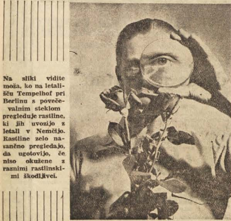
Na sliki vidite moža, ko na letališču Tempelhof pri Berlinu s povečevalnim steklom pregleduje rastline, ki jih uvozijo z letali v Nemčijo. Rastline zelo natančno pregledajo, da ugotovijo, če niso okužene z različnimi rastlinskimi škodljivci.