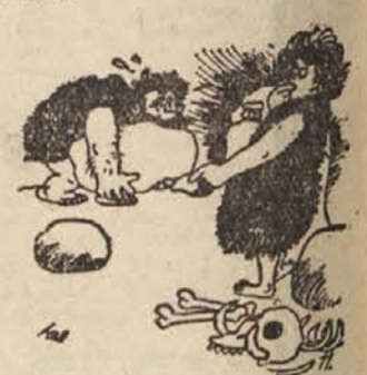
»Zdi se mi, da bi se ta tamni še bolje prilegal.«

Med Haydnovimi deli ima eno čuden naslov: »Simfonia presečenca«. Nastalo je takole. Haydn je opazil, da med njegovimi koncerti mnogi poslušalci zlasti ženske, radi zadržujejo in da nekateri celo zaspe. Da bi to preprečil, je skomponiral to simfonijo, ki je res simfonia presečenca, kajti sredi prijetne in tihe glasbe, ko se nihče tega ne nadeja, nenadoma na vso moč zadoni boben. To je seveda zdrnilo speče »ljubitelj« glasbe in potem so pazljivo poslušali skladbo do konca.