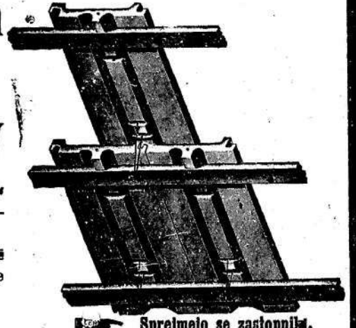
Sprejmejo se zastopniki