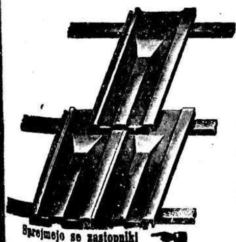
Sprejmejo se zastopniki