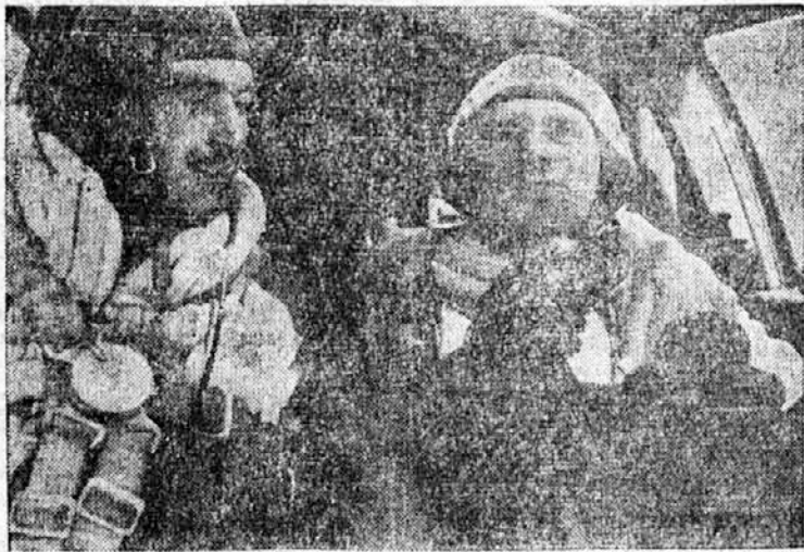
Ta dva si verjetno pripovedujeta svoje doživljanje z letalske fronte

Del Varšave je obkrožen z visokim in debelim zidom. To je getho ali židovsko predmestje. V tem izoliranem delu današnje Varšave stanuje nad 2 in pol milijona Židov. Promet med tem delom Varšave in ostalim je nastrojje zabranjen. Ker pa se v židovskem delu nahajajo tri katoliške cerkve, imajo katoličani do njih poseben ograjen dostop, tako da ne morejo spota priiti v stike z židovskim prebivalstvom.