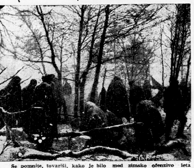
Se pomnite, tovariši, kako je bilo med zimsko ofenzivo leta 1944 v »Kozjih stenah« na Primorskem? Tudi o tem se bomo pomenili na Okroglic!