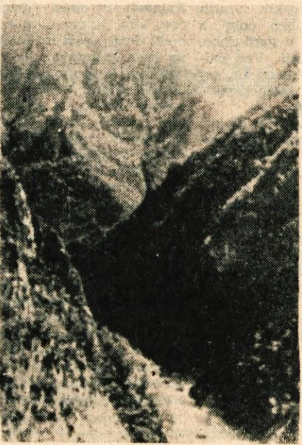
Kanjon reke Pive v bližini vasi Martinj

Sutjeska je ozka reka, široka vsega 10 metrov. V maju in juniju najbolj