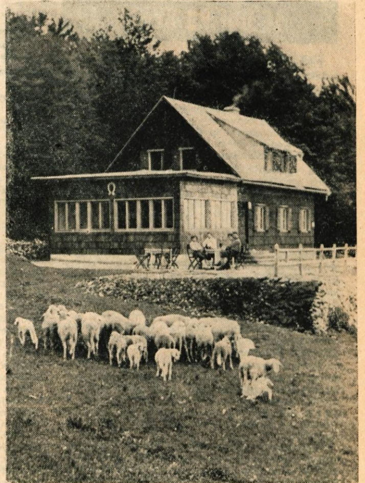
Planinsko društvo Križe je letos povečalo kočjo na Kriški gori z verando.