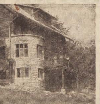
PLANINSKI DOM NA SVETINI

Ob nedeljah vidimo velike skupe delavcev... Planinstvo se je v zadnjih dveh letih zelo razmahnilo.