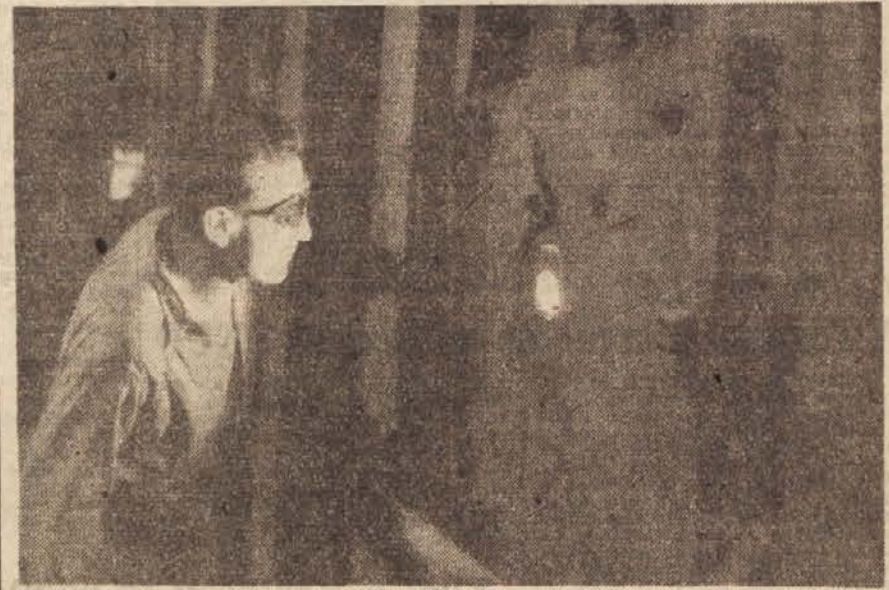
Večkrat je treba pogledati v žarečo gmo in martinokki

Zelo pomembna racionalizacija, ki pa ni važna samo za jeseniško železarno, so