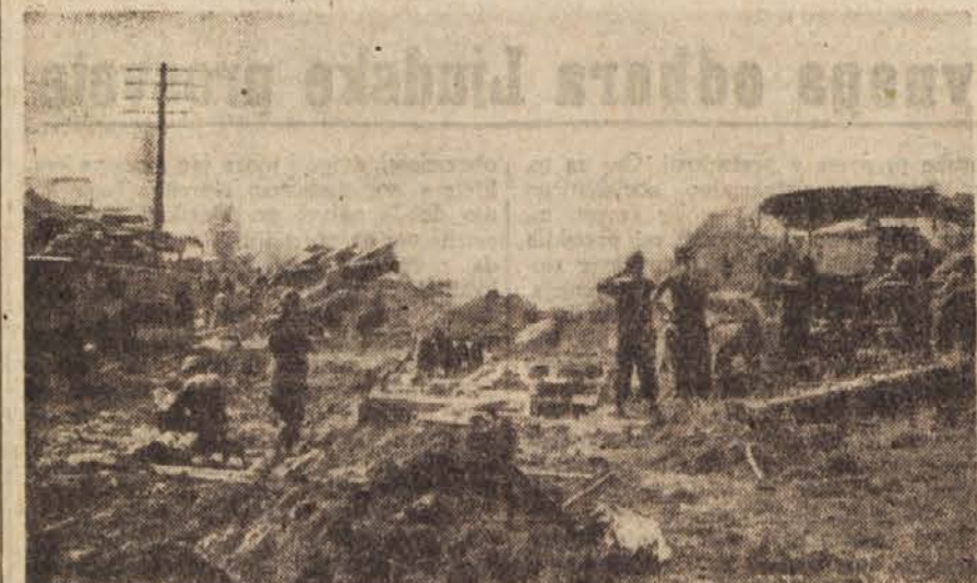
Ameriško topništvo med boji na Koreji

Po Reuterjevem poročilu je glavna ovira za uspešnejše delo v palestinskih begunskih taboriščih pomanjkanje kvalificiranega bolniškega osebja, v nekaterih taboriščih pa še slabe higienske razmere in še slabša preskrba z vodo.