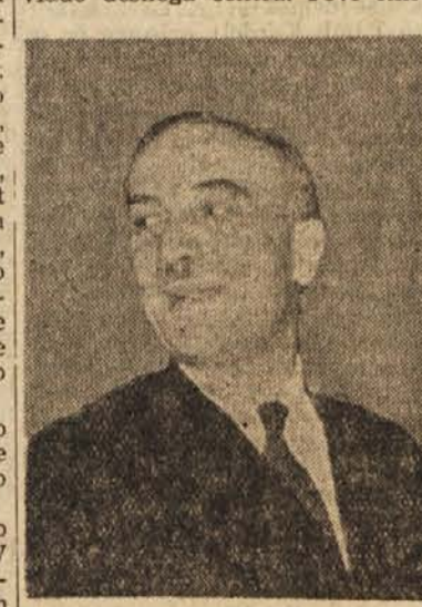
Amintore Fanfani, predsednik nove italijanske vlade

Dva činitelja sta, ki sta nepričakovano ublažila hude spore med Fanfaniem in desnico ter privedla do tega, da je voditelj demokristjanske levice sestavil vlado, ki jo lahko označimo za vlado desnega centra. Prvi čini-