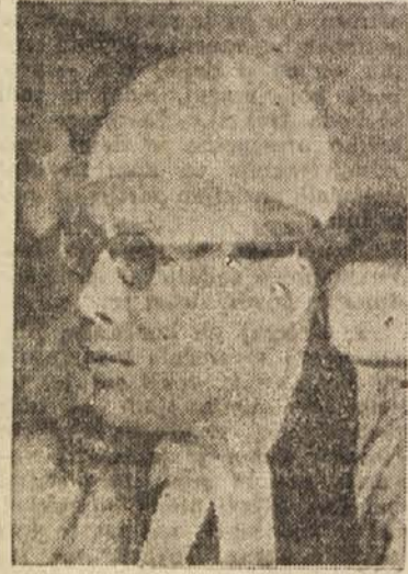
U Ba Sve, predsednik burmanske vlade

Rangun, 18. jan. (AFP). Predsednik burmanske vlade U Ba Sve je novinarjem izjavil, da je bil ustanovljen koordinacijski odbor socialističnega protikolonialnega urada. Protikolonialni odbor ima nalogo podpirati dežele, ki so še