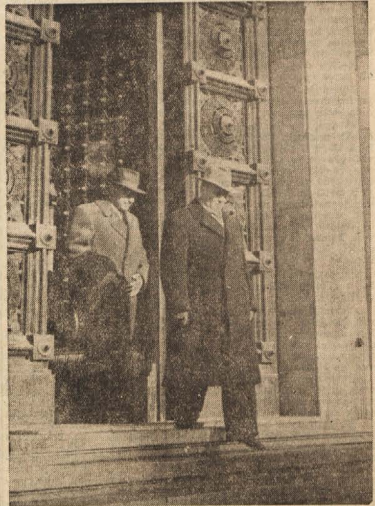
Tovariš Tito odhaja iz poslopja CK ZKJ v Beogradu, kjer je bil tretji plenum

Socialna demokratska stranka bo imela za časa konference v Berlinu poseben biro, ki ga bosta vodila dva člana vodstva Ollenhauer ali Mellies. Eden izmed njih bo stalno v Berlinu.