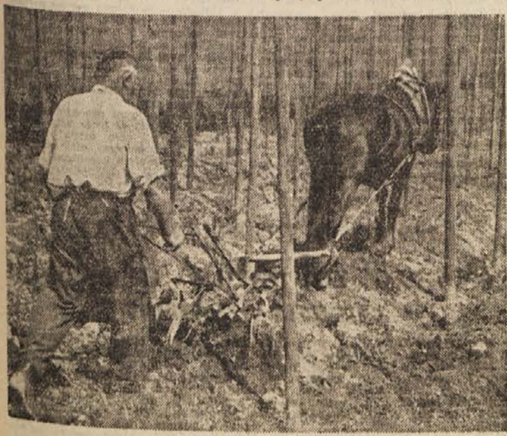
Okopavanje hmeljarskih nasadov

Strokovnjaki pravijo, da bi se z ureditvijo tega načrta narodni dohodek Jugoslavije povečal na leto za 14 milijard. Po »hidrosistemu Sumadija«, kakor imenujejo ta načrt, bi umetno namakali skoraj enako veliko področje, kakor ga določa za namakanje desetletni plan razvoja kmetijstva v FLRJ.