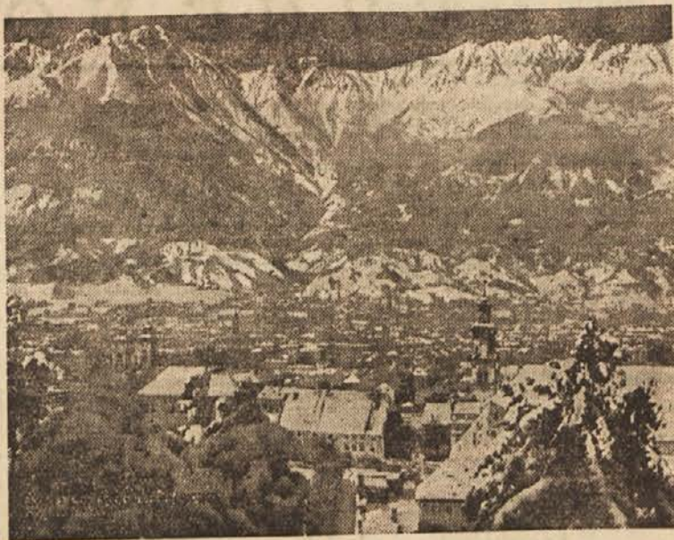
Pogled na Innsbruck pod snežno odejo

Boj s snežnimi meteži se je znova začel. Drugo ameriško letalo je priletelo v Frankfurt prejšnjo nedeljo zvečer. Tam so izročili zdravilo pilotu letala tipa »Dakota«. V Fürstenfeldbrucku je prevzel dragoceno zdravilo helikopter, ki naj bi ga pripeljal v Innsbruck. Toda helikopter se je moral zaradi snežnih metežev vrniti. Zato so odpeljal zdravilo naprej z avtomobilom. Toda ceste so bile zatrpane s snežnimi zameti. Šele v nedeljo proti poludnevju je zdravilo končno prispelo v Innsbruck.