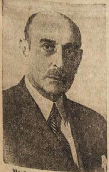
Maršal Aleksander Papagos

Ljubljana, 18. jan. Predsednik grške vlade maršal Papagos je na svojem potovanju v Pariz danes zapustil Jugoslavijo.