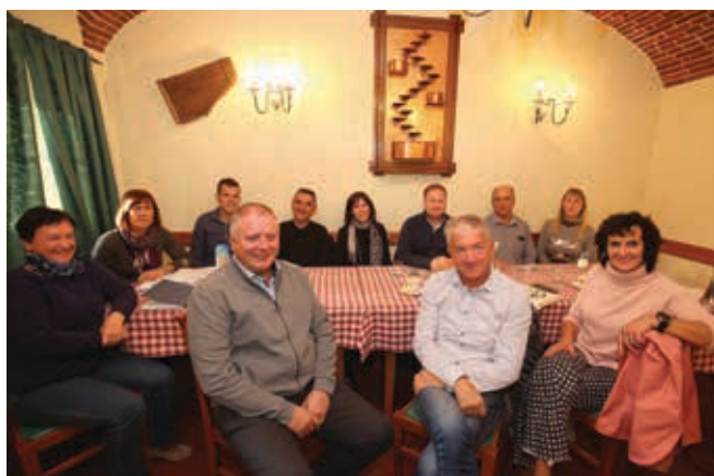
Srečanje NPR v Cerknici