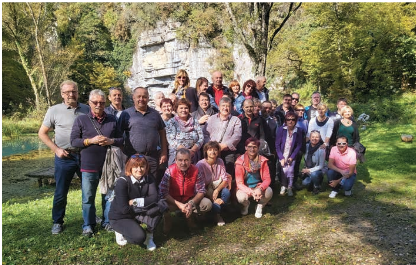
Izletniki OOOZ Vrhnika pri izviru Krupe

Vožnjo smo nadaljevali med griķi ob Kolpi, mimo stelnikov in brezovih gajev ter se ustavili pri vojaško-transportnem letalu DC 3 Dakota, spominu iz II. svetovne vojne. Nadaljevali smo do Adlešićev, kjer so nam na etnološki kmetiji prikazali izdelavo tradicionalnih belokranjskih pisanic – pirhov in predelavo lanu ter tkanje platna. Po sprehodu skozi središće Črnomlja smo dan zaključili v Podzemlju, kjer so nam za večerjo postregli jagenjčka na belokranjski naćin in druge dobrote.