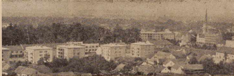
Sobota, kot jo lahko redkokdaj vidimo

Ekipa petnajstih strokovnjakov je pričela danes v soboški Fazaneriji z vrtnanjem vodnjakov za soboški vodovod. Ze včeraj in predvče-