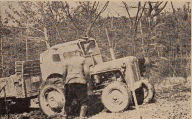
Se malo in jesensko blato bo našim traktoristom naredilo marsikatero preglavico

to bo narekovalo tudi število prehodnikov z maloobmejnimi dovoljenji, ki se iz dneva v dan veča. Samo v petek,