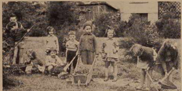
Kot smo pred nedavnim že poročali, so v Ljutomeru pri stanovanjskih blokih ustanovili otroški hišni svet. Kot vidite na sliki: nič več potepa po cesti!

Novi olimpijski bazen v Radencih gradijo na zelo primernem mestu in pričakovati je, da bo, ko bo dograjeno, privabljalo v Radence iz leta v leto več turistov iz sosednjih republik kakor tudi iz inozemstva.