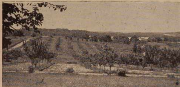
Zadrugni sadovnjaki v Budincih na Goričkem

V beltinski občini že dalj časa ugotavljajo potrebo po novi mehanični delavnici, saj so postali delovni prostori »Ključavničarstva« pretesni. Pred kratkim so se odločili, da bodo začeli z novogradnjo, gospodarske organizacije pa so obljubile, da bodo v ta namen posodile občinskemu investicijskemu skladu okrog 3 milijone dinarjev.