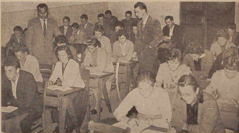
Tudi na Tišini šola za odrasle

Za letos torej lahko ugotovljamo, da so pogoji za kooperacijo mnogo ugodnejši in da kot vse kaže, tudi ne bo potrebno premagovati tolikih težav, kot minula leta ter da je tudi v načelih proizvodnega sodelovanja med kmetijskimi organizacijami in zasebnimi kmetovalci mnogo manj nejasnosti.