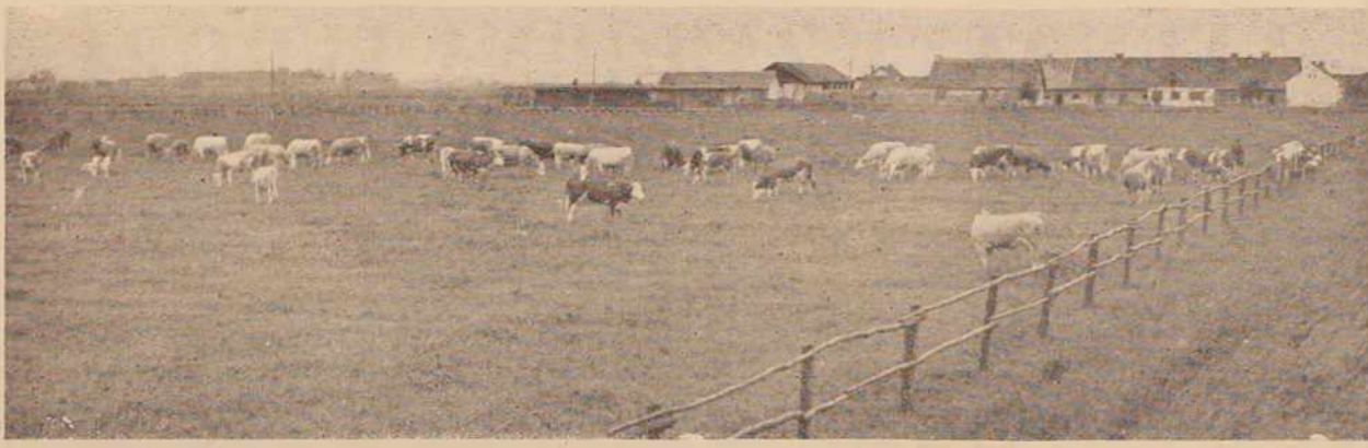
Pašnik Kmetijskega gospodarstva Rakičan na delovišču v Murski Soboti

Na Negovskem jezeru, ki se je uveljavilo kot zelo primeren turistično zatočišče, so te dni v teku zadnje priprave za otvoritev sezone. Ob jezeru, ki so ga deloma očistili, bodo te dni dogradili tudi primeren bife in sanitarije. Dela je organiziralo radgonsko Turistično društvo, s sredstvi pa sta pomagala tudi Občinski ljudski odbor in Vinogradniško gospodarstvo.