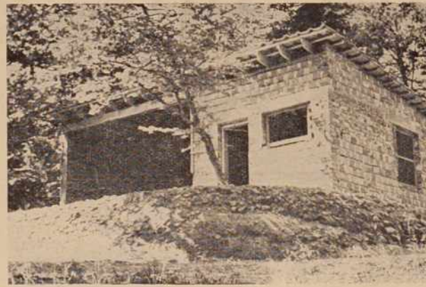
V teh dneh dograjujejo pri Negovskem jezeru tudi novi bufet, ki bo nudil izletnikom razna hladna jedila in pojače

ne Podlunšek. Za gradnjo doma so prispevale svoj delež tudi nekatere gospodarske organizacije in posamezniki. Dom bo velika pridobitev, ne samo za radioklub, marveč tudi za vse Pomurje, predvidevajo pa, da ga bodo izročili svojemu namenu že v mesecu oktobru letos.