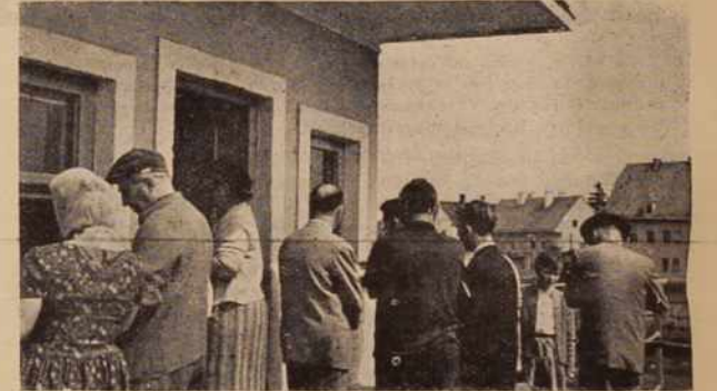
Na obmejnem prehodu v Gornji Radgoni vlada vse večji promet. Poleg rednih prehodov z maloobmejnimi izkaznicami, zadnji čas potuje skozi Gornjo Radgono mnogo turistov z rednimi potnimi listi, bodisi, da potujejo na morje ali v druge predele Jugoslavije.

vičeni. Izkušnje v radgonski občini namreč kažejo, da so na območjih, za katera so bili doslej predpisani obvezni agrotehnični ukrepi, dosegli vidne uspehe. Tako so na primer na območju Sratovec zabeležili povprečen donos 33 metrskih stotov po hektaru, na območju Lomanošev in Podgrada pa 36 stotov, medtem ko je znašalo povprečje v ostalih krajih občine komaj 20 metrskih stotov na hektar.