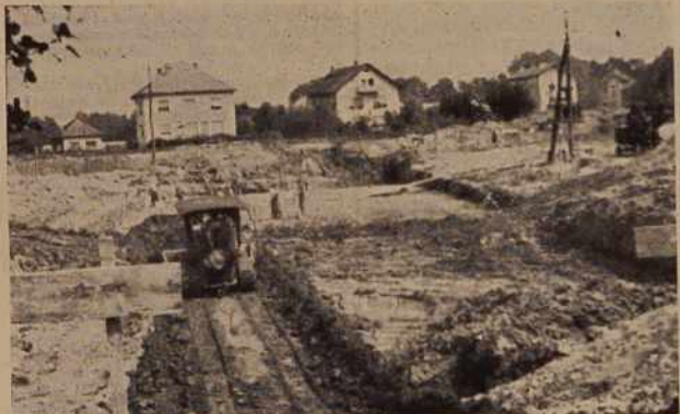
V Radencih že nekaj časa opravljajo zemeljska dela za novi olimpijski bazen, ki ga Radenci, kot celotno Pomurje močno pogreša.

Novi olimpijski bazen v Radencih gradijo na zelo primernem mestu in pričakovati je, da bo, ko bo dograjeno, privabljalo v Radence iz leta v leto več turistov iz sosednjih republik kakor tudi iz inozemstva.