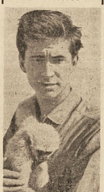
Tony Perkins je mlad filmski igralec, prijetne zunanosti nekoliko čudni, saj hodi okrog zanjavo, večkrat bos in zanemarjen, prikazuje pa precejšnje umetniške sposobnosti. Zlasti med ženskimi množicami je že postal nadvse priljubljen in vse kaže, da mu je usojeno nadomestiti prerano umrlega Deana, za katerim so zlasti mlada dekleta naravnost norela in ga ameriški mladenci še vedno skušajo oponašati.