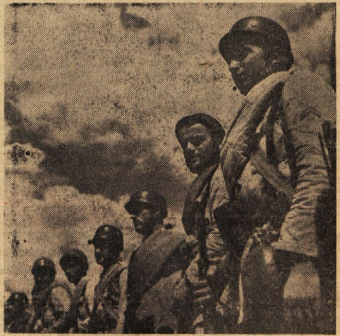
GOJENCI VOJASKE AKADEMIE PRED ODHODOM NA MARS