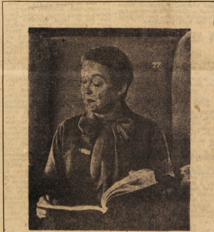
IZ FILMSKEGA ALBUMA — BETTE DAVIS

Ne čudimo se: Angleži imajo svoje pojme o — revoluciji.