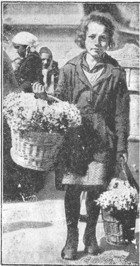
Mlada prodajalka narcis.