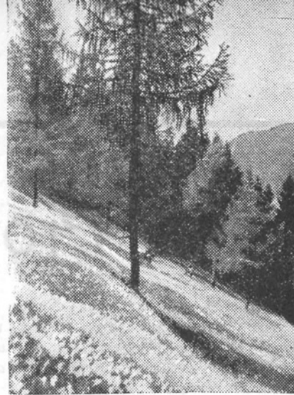
Golico krase narcise.

kaotični. Iz struj, ki so se izdvojile, dihajo hkratu nemir, eksotičnost in nesigurnost. Nad splošno veljavna načela se je povsod dvignilo skrajno egocentrično geslo: »Nič čezme, ničesar nad menoj!« Razum se je zatekel v odurne, ledene puščave geometrije, aritmetike, tehnike, arhitekture, filozofskih hipotez, revolucionarnih direktiv, ki vzhajajo in ugašajo v kavarnah ob cvičku ter črni kavi. Človek je pregnan v puščavo, čustvo izobčeno, občutljivo srce v tej temi žalostno laja kakor pes v mrzli noči. Pod egoizmom, ki si nadeva v debatah in programih masko kolektivističnih načel, sramotno hira socialni čut. Vedno bolj se v praksi uveljavlja pravilo: Homo homini lupus — človek človeku volk. Človek v mestu, čovek so-dobnosti, človek, ki zida babilonski stolp, ta človek je zgubil pregled in orientacijo.