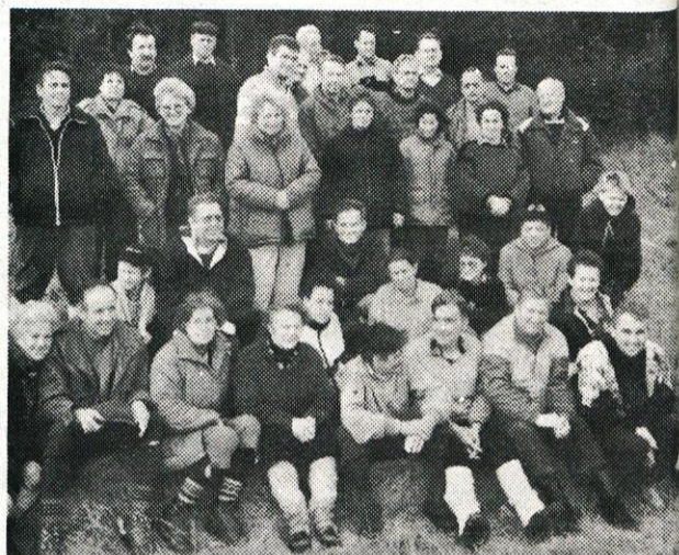
Skupina kamniških planincev vesela in zadovoljna, da so bili na Snežniku ali v njegovi bližini