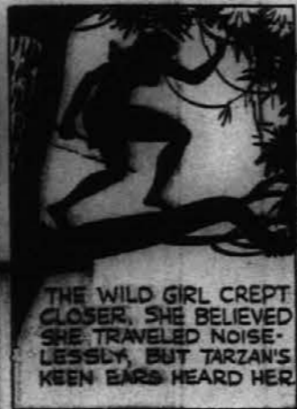
Divja deklica je prišla še bližje. Prepričana je bila, da se približuje neslišno, toda Tarzanovo dobro uho jo je zaslišalo. Vedno pripravljen na nevarnost