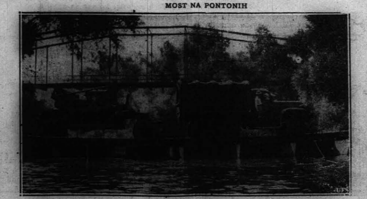
Med manevri 2. armade, ki so se vršili v Missouri, so morali inženirji zgraditi za transportacijo vojaštva in materiala začen most na pontonih, in sicer takorekoč tik ob pravem mostu. Pravi most je bil namreč preslah za veliko težo.