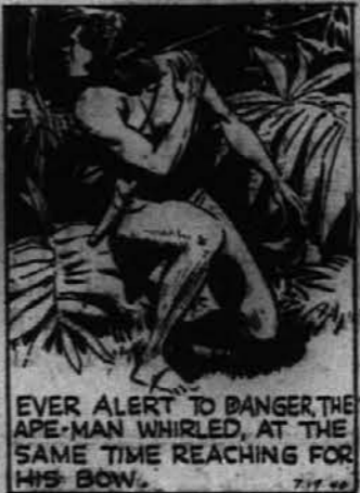
je Tarzan prijel za lok. — Tarzelino obotavljanje je izgnilo. Njen sovražnik se je pripravil. Ona mora ubiti — ali biti ubita.