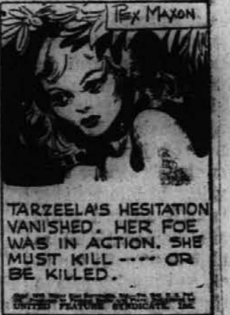
je Tarzan prijel za lok. — Tarzelino obotavljanje je izgnilo. Njen sovražnik se je pripravil. Ona mora ubiti — ali biti ubita.