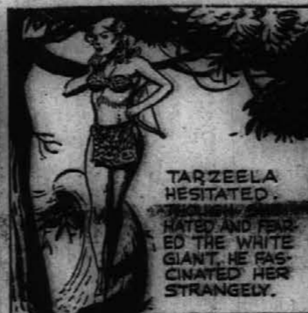
Tarzela je postala neodločna. Kljub temu, da je sovražila in se bala belog velikana, je čutila neko privlačnost do njega.