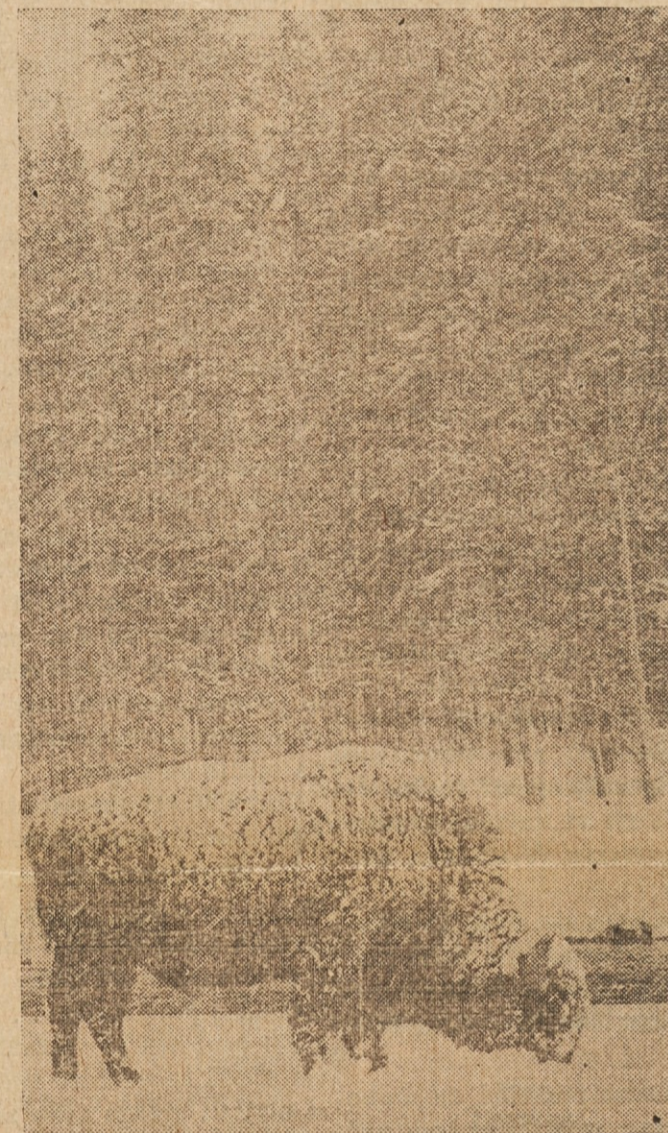
ZIMA IN SNEG GA NE VZNEMIRJATA — Bivol v Montani se malo meni za zimo in mraz, ko išče travo pod snegom.