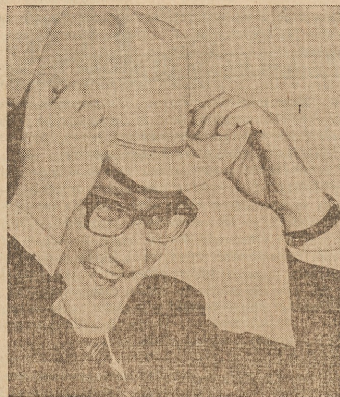
Z RAZLIČNIMI KLOBUKI — Državni tajnik H. Kissinger je v Houstonu pomerjal kovbojski klobuk, ki mu pristoji menda prav tako dobro kot diplomatski.

RALPH NADER SVARI — Znan zastopnik in zagovornik koristi potrošnikov Ralph Nader opozarja senatni odbor za upravo na nujnost trdega izvajanja zakona proti trustom napram oljnim družbam.