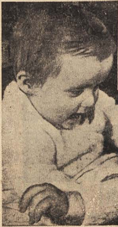
Enega izmed sedem mesecev starih dvojčkov, ki ju vidite na sliki v pristrčni igri, si je pred dnevi »izposodila« britanska televizija, ker ga je potrebovala za televizijsko komedijo »Izposojen dojenček«. — Preden sta dvojčka prišla na svet, so se njuni starši zavarovali za 400 funtov prav proti — dvojčkom.