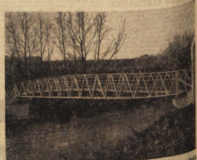
V sodobni tehniški dejavnosti se čedalje bolj uveljavlja aluminij. Zlato ki so ga že pred desetletji označili za kovino bodočnosti. Zdaj ga uporabljajo že v številnih industrijskih panogah, gornji posnetek pa kaže most čez angleško reko Ebbw v južnem Walesu; pri gradnji so uporabili izključno aluminijasto konstrukcijo.