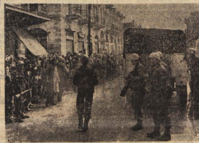
Varnostne sile OZN patrolirajo na glavni ulici Gaze za časa demonstracij prebivalstva

Londonski politični krogi pričakujejo, da bo dal minister za kolonije Lennox-Boyd v Spodnji zbornici novo izjavo o položaju, ki je nastal v zvezi s tem odgovorom izgnanega Makariosa.