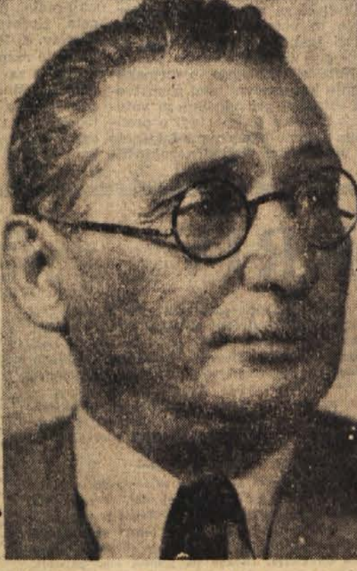
Pokojni je bil že med ljudsko revolucijo eden najuglednejših idejnih, političnih in organizacijskih kovačev narodnoosvobodilnih odborov, teh temeljnih enot nove ljudske oblasti. Plodno je

Ko je odgovarjal na ponovno zahtevo opozicije, naj bi Indija izstopila iz Commonwealtha, je Nehru rekel, da je po njegovem mnenju članstvo v tej organizaciji še zmerom koristno. Pripomnil pa je, da tudi sam čuti, da bo treba nekega dne proučiti to vprašanje. Nehru je znova poudaril stališče indijske vlade, da je Kašmir neločljivi del Indije. Glede portugalske kolonije Goe je napovedal, da se bo vlada kmalu posvetovala z voditelji opozicije o bodočih akcijah.