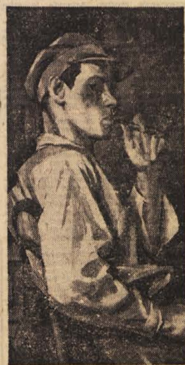
Z razstave v Moderni galeriji: Vladimir Becić: Mladi Anglič