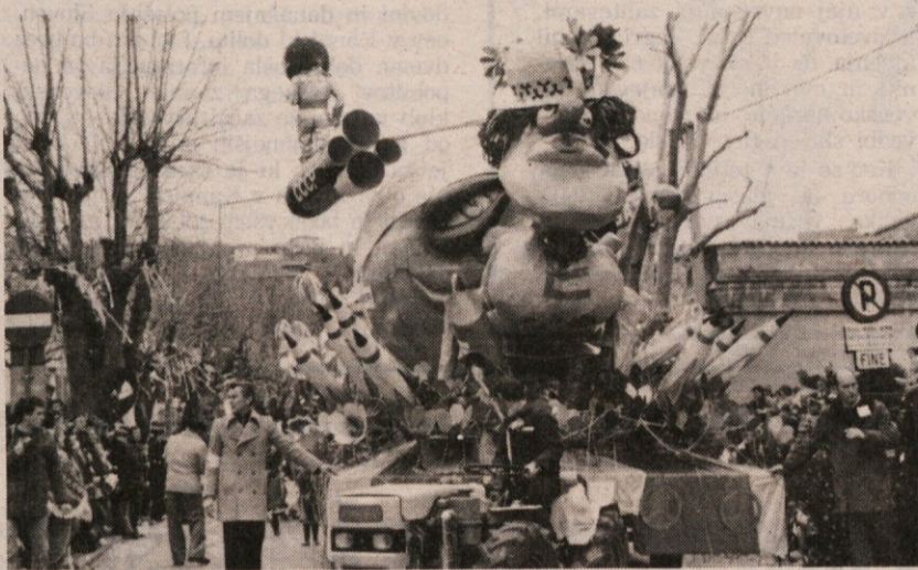
Voz skupine Lampo, ki je prejela prvo nagrado v Miljah

Tudi letos je torej miljski pust izpolnil vsa pričakovanja, ko pa so z balkona županstva nekaj tisočglavi množici razglasili končne rezultate, je bila evforija na višku, saj so bili kot se za pust spodobi, pravzaprav vseeno veseli in razposajeni prav vsi, zmagovalci in poraženci, saj je bil edini resničen in pravi zmagovalec Pust in tisti, ki so ga v tem primeru dostojno počastili. (dj)