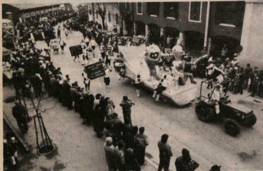
Množična skupina Križanov je s svojim »zgodovinskim« prikazom boja za globalno zaščito izbojevala na Kraškem pustu tretje mesto