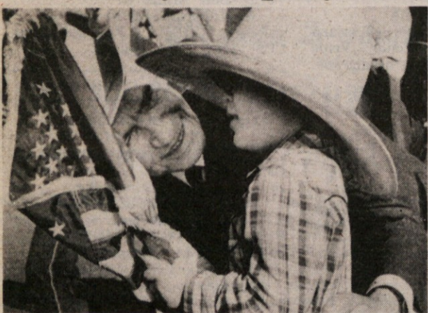
Tako so sprejeli avstrijskega predsednika Kirchsclägerja med njegovim obiskom v Kaliforniji