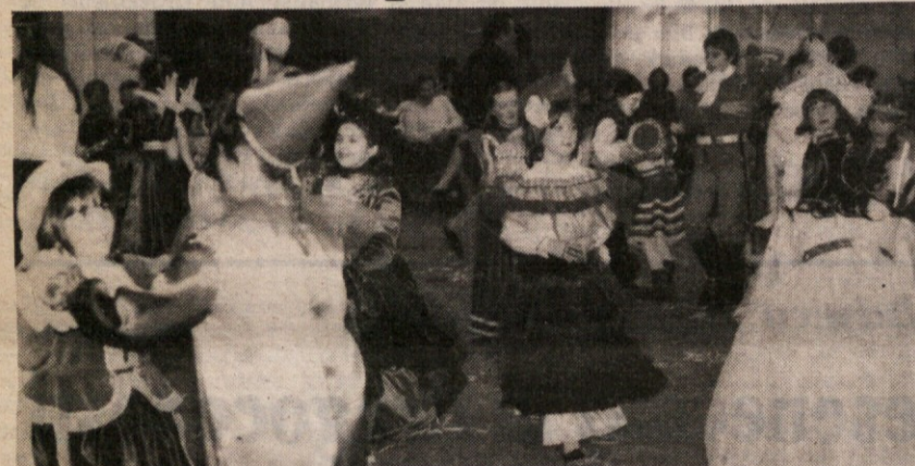
Med otroškim pustnim rajanjem v Borovem športnem centru na stadionu »1. maj«