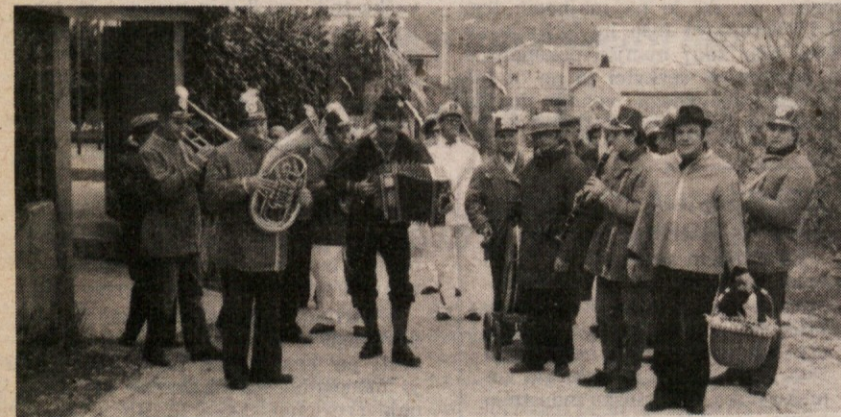
Pustni veseljaki od Domja so se tako nastavili našemu fotografu

V mestu in na podeželju so bila v nedeljo številna pustovanja, ki so jih priredila naša društva in organizacije. Še posebno na svoj račun so prišli najmlajši, saj so bila skoraj povsod na sporedu otroška pustna rajanja.