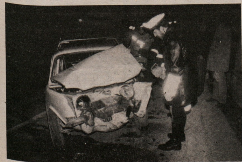
Razbitine simce, katere šofer je zakrivil hudo prometno nesrečo

Včeraj se je okoli 19. ure na cestnem odseku med Ključem in Borštom dogodila huda prometna nesreča, ki je terjala dve hudo ranjeni osebi, ki so ju sprejeli v tržaško splošno bolnico s pridržano prognozo.