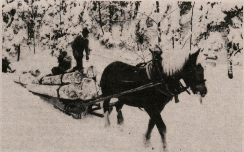
Močan konjič, sani in na njih hlodi, ki lahko simbolizirajo zimo: naj jih konj kar hitro odpelje in naj se k nam vrne pomlad, ki jo po hudem mrazu je nestrpno čakamo