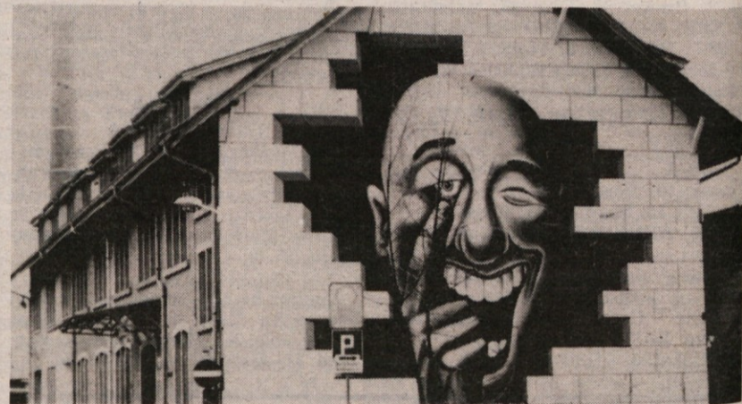
Pustna mrzlica ni prevzela samo ljudi, ampak kaže, da tudi stavbe, ki so se začele šemiti. V pustnem času je zares narobe svet