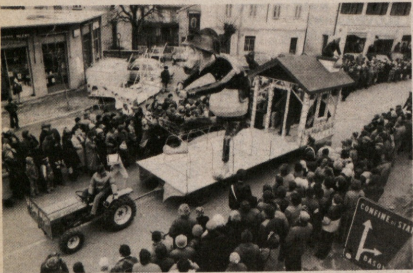
Na sobotnem 18. kraškem pustu na Opčinah so zasedli domačini s svojim »karabinjerskim mačkom«, ki pazi na hišne miši, drugo mesto