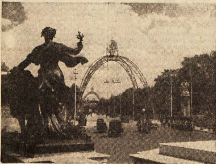
Pod slavoloki se bo pomikal slavnostni spreved

Vse je šlo gladko, dokler neka radovedna ženska ni vzela škarij in odprla zavitka: bila je seveda zelo razočarana, ko je našla v njem namesto denarja kose papirja. Zadeva je prišla pred sodišče.