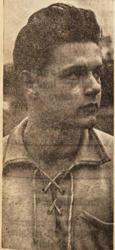
Penko, naš najbolj nadarjeni mladinec za atletske mete

Ce na kratko preletimo rezultate tega kola, moramo omeniti rezultat »Dinamca«.