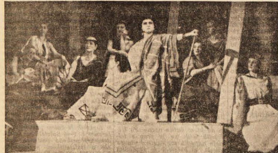
Prizor iz Aristofanove komedije »Lisistrata« v uprizoritvi ljubljanskega Mestnega gledališča