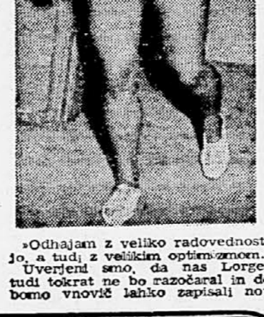
»Odhajam z veliko radovednostjo, a tudi z velikim optimizmom.«

»Srečal se bom s najboljšimi evropskimi tekašicami, kot sta Germain in Kaufmann. Če, da bi imela trenutno vsi čase nad 8 sekund, okrog 9.2. Rezen tega bom prvič v življenju dosegel, kar mi je zelo pomembno. Če, da bi imela trenutno vsi čase nad 8 sekund, okrog 9.2. Rezen tega bom prvič v življenju dosegel, kar mi je zelo pomembno. Če, da bi imela trenutno vsi čase nad 8 sekund, okrog 9.2. Rezen tega bom prvič v življenju dosegel, kar mi je zelo pomembno.«