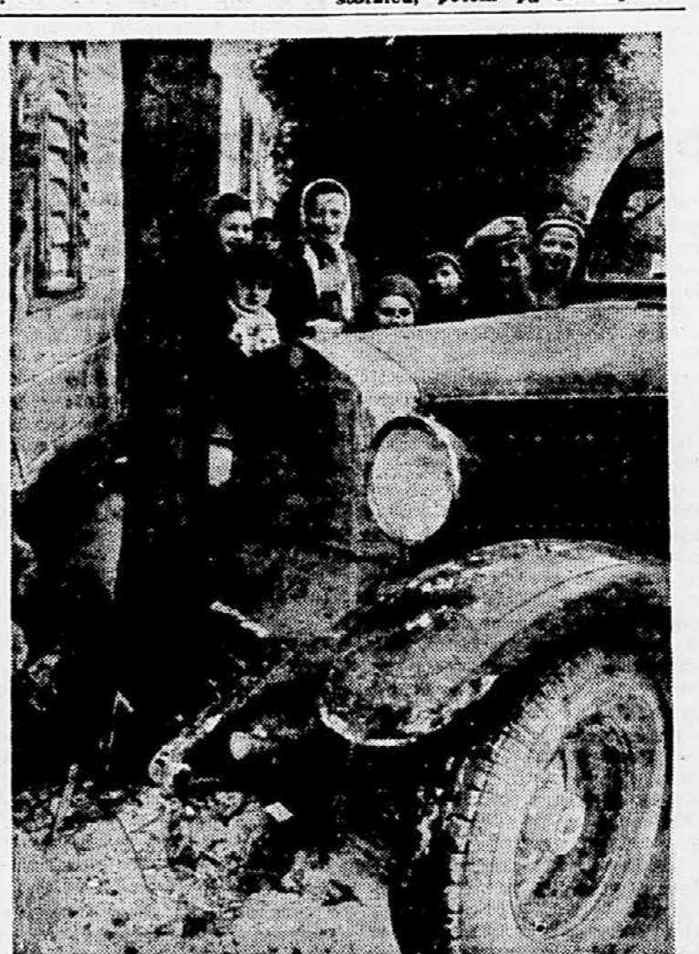
Pri Dolskem sta v ovinku trčila avtofurgon požarnega zavoda in kamion. Furgon je vrglo proti vogalu hiše, kjer je gladko prešli telefonski drog in obval precej poškodovan.

Plenum je razpravljal tudi o problematiki kreditov in obratnih sredstev. V kemični industriji je mnogo podjetij sezonskega značja. Tega pa Narodna banka ne upošteva v dovoljni meri in tako nastajajo dostikrat nepotrebne težave, ki ovirajo proizvodnjo in podražujejo bla-