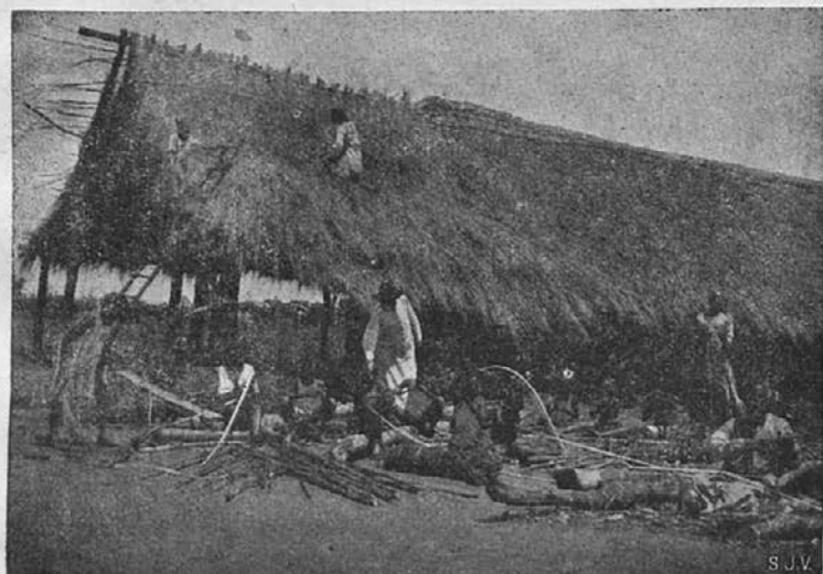
Gradba siromašne misijonske cerkvice v Afriki.