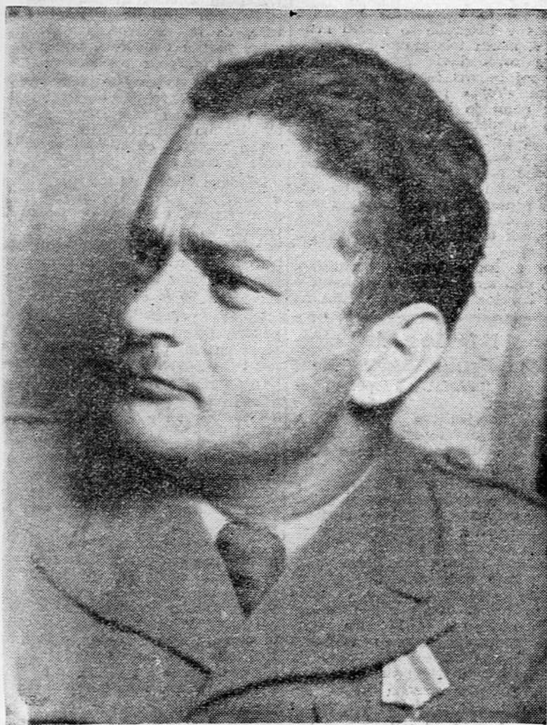
Predsednik nove vlade Ljudske republike Slovenije BORIS KIDRIČ

Ljubljana, 4. marca. Prva vlada Ljudske republike Slovenije pod predsedstvom tov. Borisa Kidriča je podala danes Prezidiju SNOS-a ostavko. Predsednik vlade Boris Kidrič je s pismom, naslovljenim na Prezidij SNOS-a v roke predsednika Josipa Vidmarja, ostavko utemeljil tako-le: