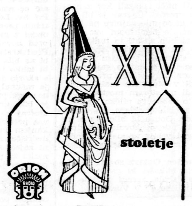
Žena je ona, ki določa okus in kulturo svojega časa. Za sodoben dom si izbere