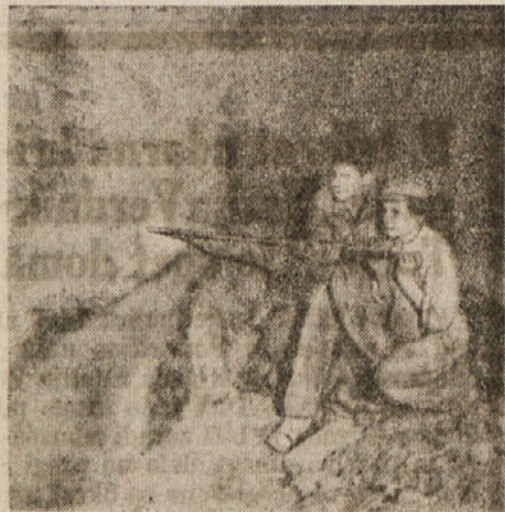
Minerji pri delu

uro je prišla z osemurnega dela. Brez večerje je popadala po pogradih in zaspala. Le komandant je hodil nemirno po sobi in gledal skozi okno v noč, v dež, ki je lil kakor iz škafa.