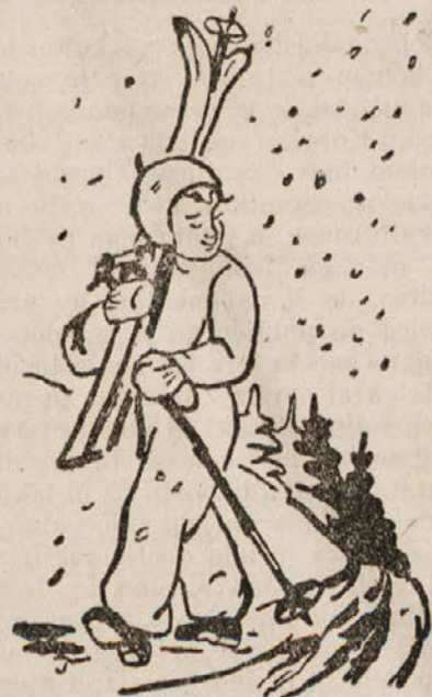
Treba bo pripraviti smučiči

Navpično: 1. mesec, 2. številka, ženski spol, 3. zaspan, 4. nočna ptica, 6. domača žival, 7. ima igle, 9. spremlja Miklavža, 10. če; v slučaju da, 12. pred-