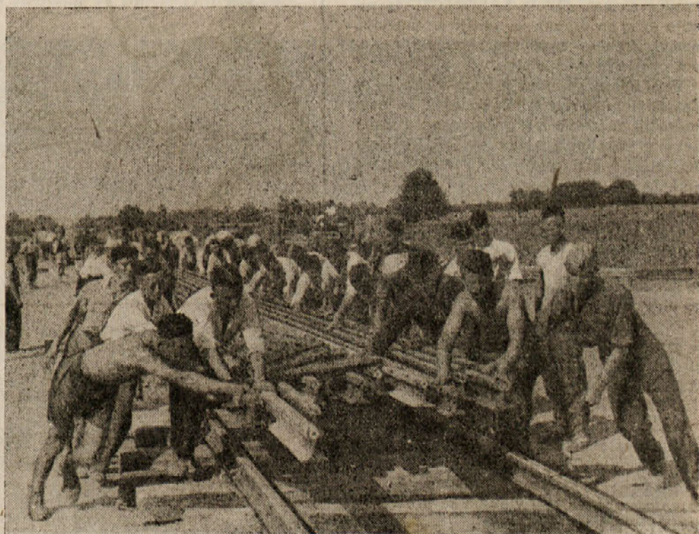
Mladinci polagajo tračnice

Vlak se ne ustavlja na vseh postajah, kajti tako ne bi prispel nekaj dni v Sarajevo — tam pa ga pričakujejo, nestrpno pričakujejo. Prav v tem času postavljajo svečane tribune, mladina jih krasi s cvetjem, po ulicah naleplja letake, obeša za-