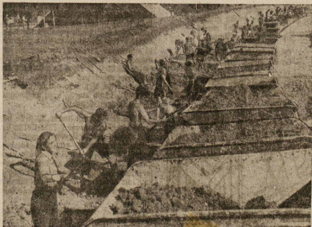
Kakor na tekočem traku polnijo vagončke z izkopano zemljo