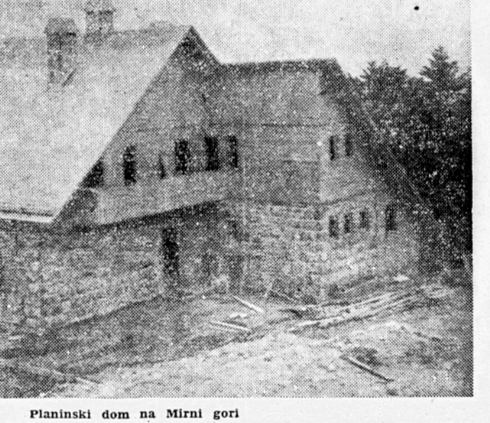
Planinski dom na Mirni gori