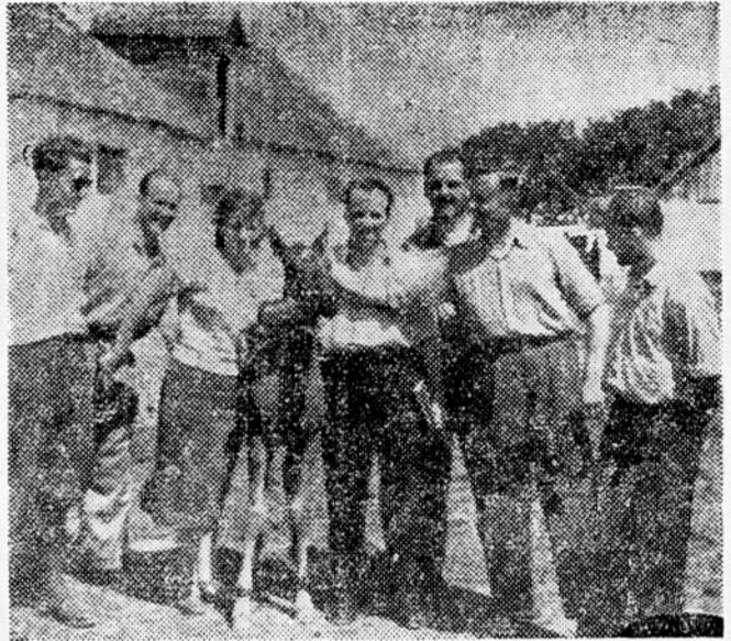
Nekaj slovenskih kmetijcev, ki so bili na poti po naši zemlji — rednici, je na državnem posestvu v Djakovu brž vzbujilo ljubeznega zrebetja.

Cepiva dobe približno na takle način: živali (konje, prašiče, ovce in osle, ki jih največ uporabljajo za te namene) okužijo, njihov organizem pa ustvarja spričo svoje naravne odpornosti — podobno kot človek, kadar se rani — protistrup, oziroma snovi, ki nevtralizirajo in so v bistvu zdravilo. Zavod »Veterum« v Kalinovici, ki ima še en obrat v Zaprešiču, vodstvo pa v Zagrebu, pričakoval toliko, da pa so dobre prijateljske in množične strokovne zveze med kmetijci Jugoslavije odličnega pomena za nadaljnji razvoj našega kmetijstva.