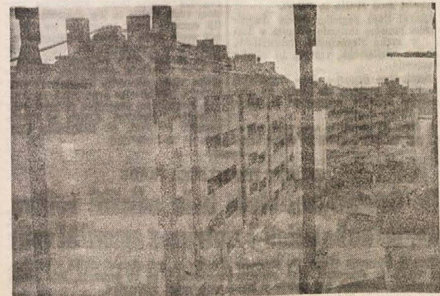
Stanovanjske hiše v Cvijičevi ulici, kjer so lani največ zidali!

Ko zdaj Beograjčani govorijo o stanovanjih, mislijo na velika moderna poslopja, ki rastejo v raznih mestnih delih. V teh poslopjih bodo delovni ljudje, borci za boljše ter srečnejšo bodočnost naših narodov, imeli prijetne domove ter našli po dnevnih naporih zasluženi počitek. N. Viktorović.