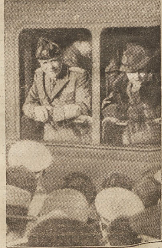
Maršal Badoglio, novi vrhovni poveljnik italijanske armade v Abesiniji, ob slovesu pred odhodom v Abesinijo na kolodvoru v Rimu.

Na včerajšnjo oceno v »Slovenca« o vprizoritvi moje igre »Rožmarin« pod okriljem Prosvetnega društva v Mariboru, naj veljajo le-te ugotovitve: 1) drugačne ocene niti nisem in bi je tudi ne mogel pričakovati. 2) Sam vem dobro, da je »Rožmarin« moja druga igra, ki pa je baš pri Prosvetnem društvu v Mariboru doživela svojo 250. vprizoritev. 3) Da bi me ne bili pregovarjali poklicni igralci in literarni tovariši k založbi tega dela, ne bi drame izdal, ker sam vem, da »na marsičem šepa«. 4) Če jo je mariborska publika, ki ima dovolj