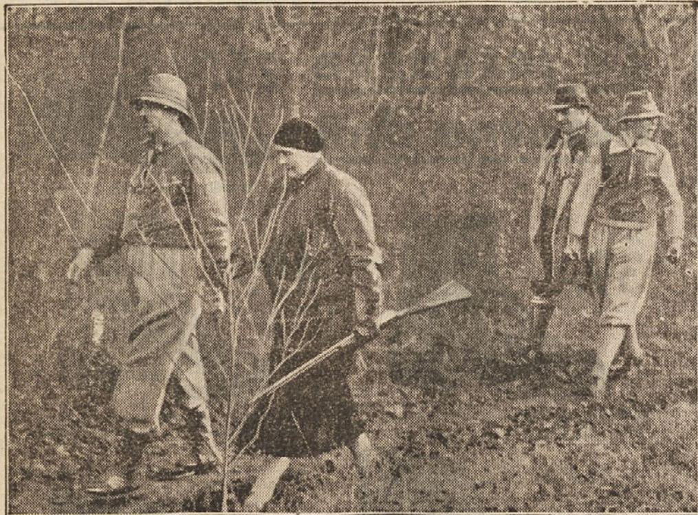
Nj. Vel. kraljica Marija, ki se mudi zdaj v Bukarešti, se je udeležila pred ... lova v bližini Bukarešte. Na sliki jo vidimo v lovišču z bratom romunskim kraljem Karolom II. in z njegovim sinom prestolonaslednikom Mihaelom.