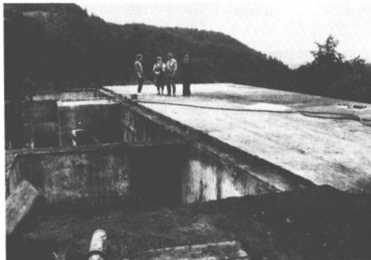
Še to kar je ostalo od gospodarskega poslopja bo treba verjetno zrušiti, saj je pustil ožen na betonski plošči in zldovju svoje sledi.