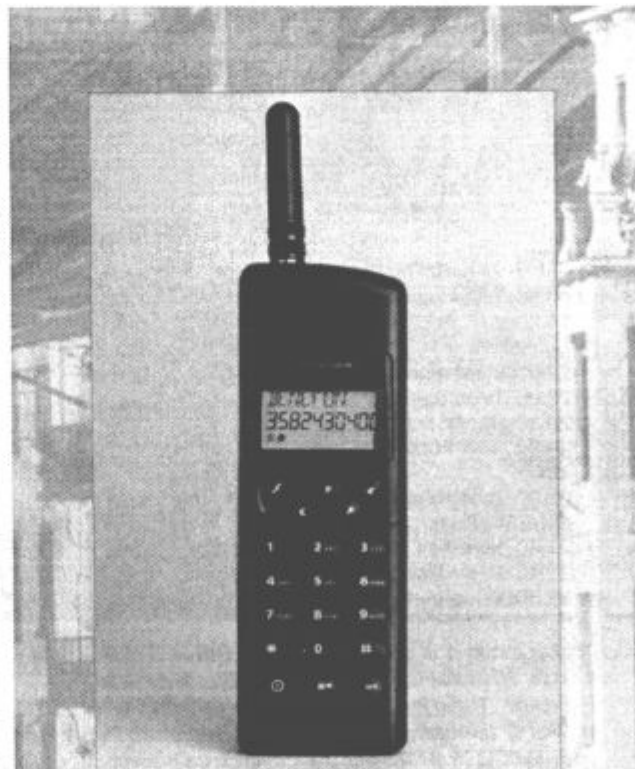
BENEFON DELTA 450i

PE CELJE, Lava 7, 63000 Celje tel.: (063) 451-334, fax: (063) 451-811