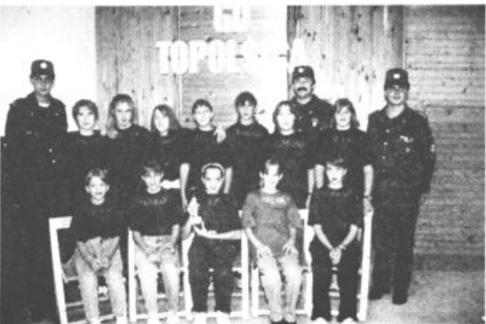
Državne prvakinja med gasilkami - mladinkami

Po tem uspehu čaka mlade gasilke še več dela in vablivo potovanje na med-