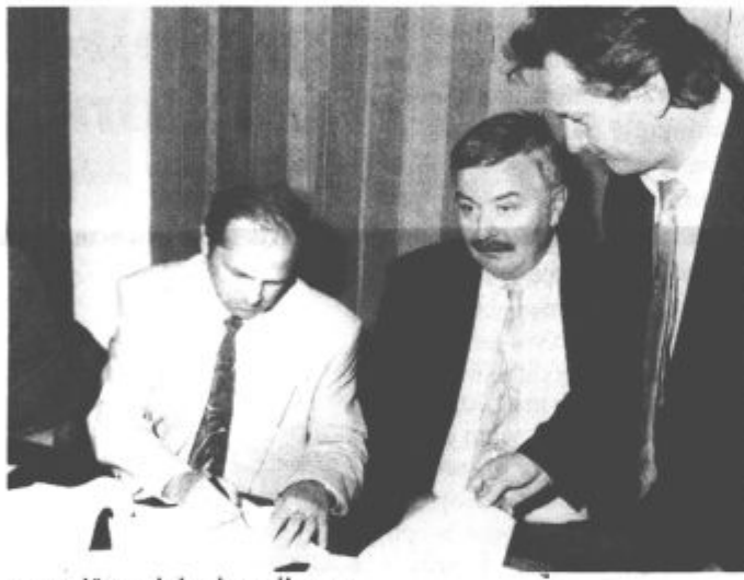
uresničevati in izrazil pre-