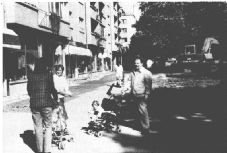
Bodoči center Velenja je pravo gradbišče, ki nam sedaj še izgleda tuje. Končno oceno bomo lahko dali šele čez približno dva meseca, ko bo obnova predvidoma končana