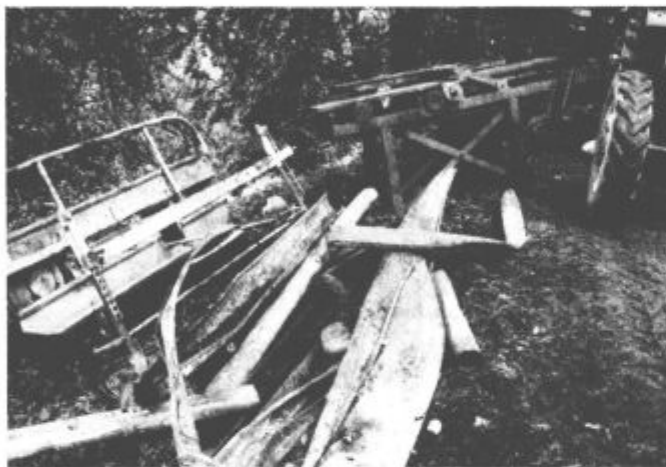
Od mnogih strojev, orodij in naprav je ostal le kup železa.