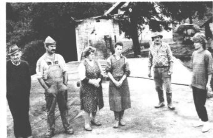
Kruto je, kar so doživeli, a časa za tamanje ni. Čaka jih kopica dela, kajti pred vrati je jesen, pa tudi do zime ni več daleč.

Vzrok požara še raziskujejo, vse pa kaže, da je nastal zaradi samovžiga sena.