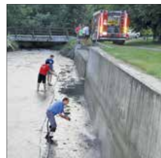
Prebivalci Mozirskih trat so očistili dno in stene.