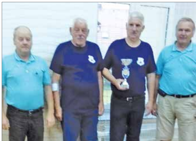
Mozirski tekmovalci so se najbolj izkazali v Bočni.