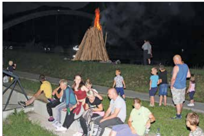
Na kresovanju je vsako leto veliko mladine, katere naloga bo spomin na osamosvojitve Slovenije gojiti tudi v prihodnosti