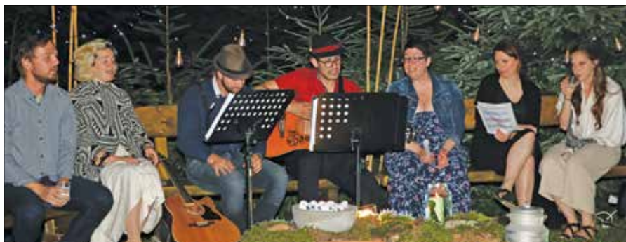
Člani Kulturnega društva Rečica ob Savinji so program, v katerega so vpletli vraže o kresni noči, pripravili ob soju sveč in bakel.