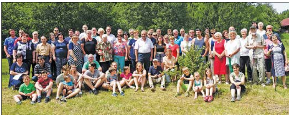
Snidenja na Logu se je udeležilo kar 73 od 134 živečih sorodnikov.