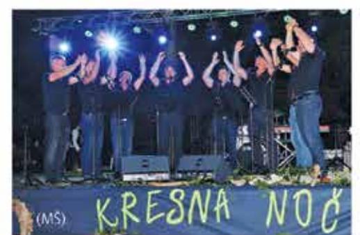
Na 5. Kresni noči v Lučah navdušila Oktetova čista petka