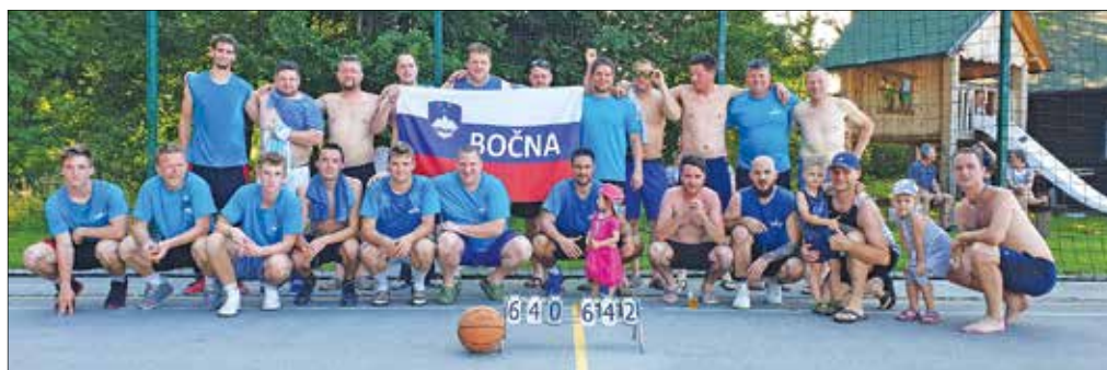
Ekipi ŠD Bočna in Gornji Grad sta se že 30-tič pomerili na 12-urnem košarkarskem maratonu. Letos je zmagala ostala v Bočni.