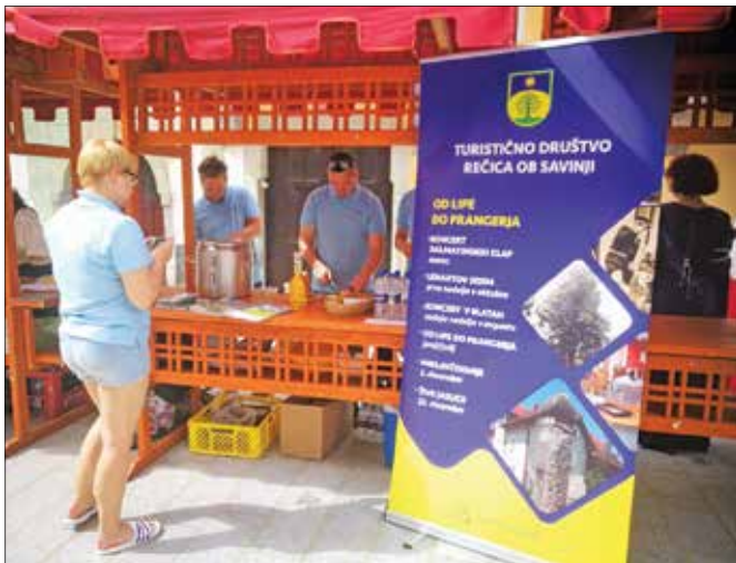
Na stojnici TD Rečica ob Savinji so obiskovalci lahko poskušali želo-dec, tolkec in domači kruh

kajšnjega čebelarškega muzeja. Slednji namreč praznuje šest desetletij svojega delovanja.