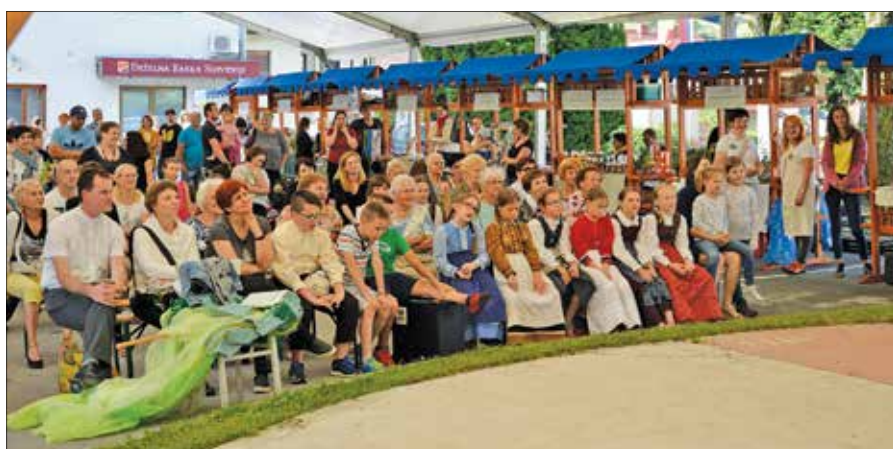
Obiskovalci so ob ogledu stojnic tudi v velikem številu prisluhnili predstavam in nastopom.

ogleda katedrale. Zaključek večera je pripadel vokalni skupini Kvatropirci, ki je navdušila poslušalce. V sklopu festivala je bilo poleg otvoritvenega in zaključnega dogodka osem delavnic. Predstavila se je tudi Osnovna šola Gornji Grad, kjer šolarjem niso tuja niti zelišča niti turizem. Učenci so odigrali predstavo o menihu, ki so jo v okviru turistične naloge pripravili v lanskem letu. Spregovorili so o sodelovanju z Zavodom Stanislava in zeliščnem