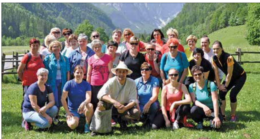
Članice Gasilske zveze Zgornje Savinjske doline v Logarski dolini