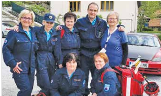
Med devetimi udeleženi je bila tudi tokrat ekipa BSH Hišni aparati Nazarje.

udeležila državnega preverjanja, ki bo 5. oktobra na Ptujju.