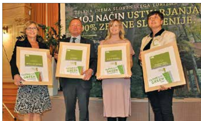
Zgornjesavinjski predstavnice in predstavnik dobitnic nazivov na slovesni podelitvi znakov Slovenia Green

Ker vse občine nimajo enakih naravnih danosti, lahko zeleno