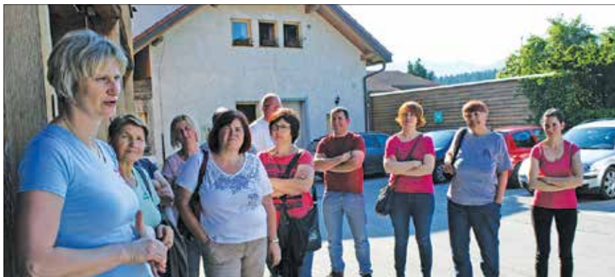
Obiskovalci so z zanimanjem prisluhnili predstavitvi različnih dopolnilnih dejavnosti v Brinečevem mlinu.