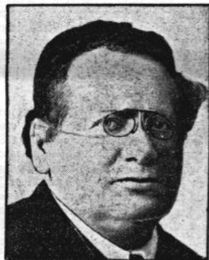
Litvinov, ruski minister za zunanje zadeve.

Po nemških poročilih je dobila Nemčija ob priključitvi Avstrije: 1. Umetniške zbirke neprecenljive vrednosti, ki so bile last države in Habsburžanov, med drugim tudi zbirko gobelinov, vse v vrednosti okoli 900 milijonov dolarjev. Te zbirke je konferenca poslanikov v Parizu leta 1919. ocenila na 9 milijard zlatih frankov. 2. Zlati zaklad avstrijske Narodne banke v višini 750 milijonov šilingov v zlatu in devizah. 3. Zasebno zlato, ki se je moralo na osnovi dekreta iz meseca aprila oddati nemški državi