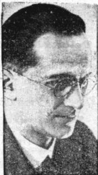
Konrad Henlein, vodja sudetskih Nemcev.

s svojimi pretiranimi zahtevami. Po dolgotrajnih razgovorih, ob katerih se je večkrat zdelo, da mora vsak trenutek izbruhniti vojna, kaže sedaj položaj nekoliko bolj mirno. Nevarnost seveda še ni odstranjena, vendar menijo nekateri glasovi, da bo mogoče doseči sporazum brez prelivanja krvi. Ako se to posreči, bo imela