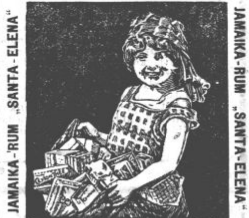
JAMAIKA-RUM „SANTA-ELENA“ TOIFLOV TALANDA CEYLON-ČAJ

s koncesijo ob zelo obljudeni cesti 20 minut od Celja, na pročelju 9 oken, velika gostilniška in posebna soba, 5 sob za stanovanje, lep gostilniški vrt, veliko dvorišče in vrt za zelenjavo, gospodarska poslopja z hlevi, vse prenovljeno, se takoj prodaja z vsem inventarjem za 15000 K. Vknjižba hranilnice 6000 K. 58 3-1 Naslov pri upravnistvu „Narodnega Dnevnika“.