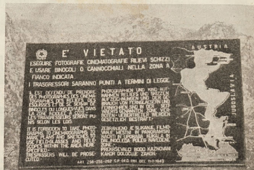
Vojaške služnosti povzročajo veliko škodo gospodarstvu dežele

2/3 občin naše dežele je podvrženih vojaškim služnostim. V nekaterih občinah ni dovoljena na 90 odst. površine nobena sprememba. Na področjih, kjer velja zakon o vojaških služnostih, ni dovoljeno graditi hiš, kopati jarkov, graditi cest, graditi obcestnih zidov, višati že obstoječih poslopij, graditi nasipov. Ni dovoljeno niti pogozdo-