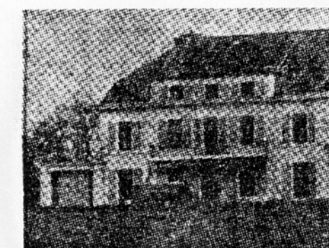
Vilo (spodaj), v kateri bo med ženevski konferenco prebival šef kitajske delegacije Ču En La, so švicarski vojniki predhodno iz varnostnih razlogov obdali z gosto bodečo žico (desno).

Beograd, 26. aprila. Kot je izvedel Jugopres, je bil te dni v Sofiji podpisan sporazum med Jugoslavijo in Bolgarijo o načinu raziskovanja in reševanja obmejnih incidentov. Zvedelo se je tudi, da se bodo 28. aprila pričeli v Niški banji razgovori med predstavniki jugoslovanske in bolgarske vlade o obnovitvi obmejnih znakov na skupni meji.