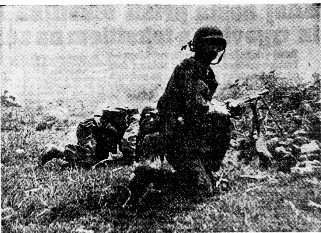
HANOI, 26. aprila (AFP). Ves večerajšnji dan in vso noč so Ho Si Minhove sile izvajale močan pritisk na severne in severozahodne položaje obkoljenega francoskega oporišča Dien Bien Fu, njihova artilerija pa je s koncentriranim ognjem točila francoske položaje. Branilci Dien Bien Fuja so sedaj stisnjeni v krog, katerega premer znaša 1200 metrov. Vse napade so vzdružili v rovi, ki so jih skopali samo nekaj metrov od položajev, izgubljenih ob koncu prejšnjega tedna. Zaradi zboljšanja atmosferskih pogojev je bilo večeraj v akciji vse razpoložljivo francosko letalstvo, ki je bombardiralo položaje Ho Si Minhove protiletalske artilerije, vtem ko so transportna letala spuščala s padali obleganemu oporišču municijo in drugo gradivo. Francosko letalstvo je prav tako bombardiralo nasprotnikove komunikacije, predvsem ceste, po katerih se preskrbujejo Ho Si Minhove enote.

Churchill večerj sklical v Londonu. Zastopnik zunanega ministrstva je odklonil izjavo o vesteh v časopisih, da je Francija prosila Veliko Britanijo za pomoč v Indokini glede na kritični položaj pri Dien Bien Fujui. Vprašanje Indokine in anglo-ameriške vojaške pomoči Franciji pa je po mnenju obveščenih krogov v središču zanimanja britanske vlade. Politični krogi ne skrivajo, da je večerajšnji sestanek vlade še bolj dramatičen to vprašanje. Glede na to pričakujejo, da bo moral britanski predsednik že jutri odgovoriti na interpelacijo. Po-