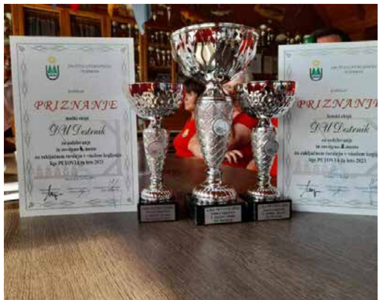
Priznanja lige Petovia