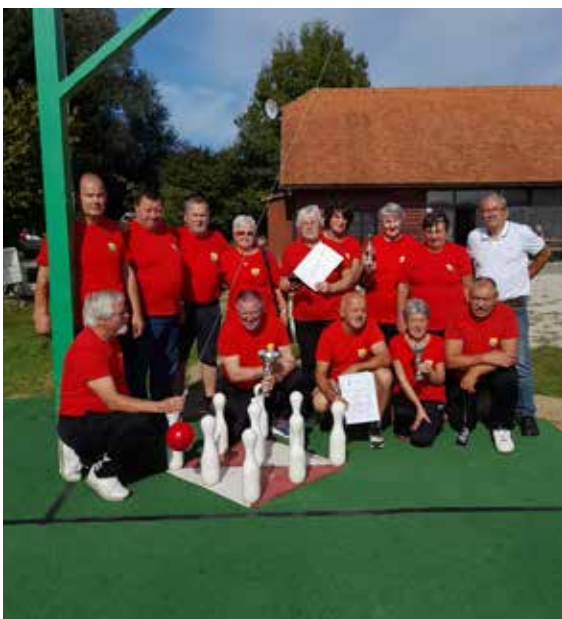
Zaključni turnir lige Petovia

Pripravil: Feliks Majerič Uredila: Špela Pokeržnik