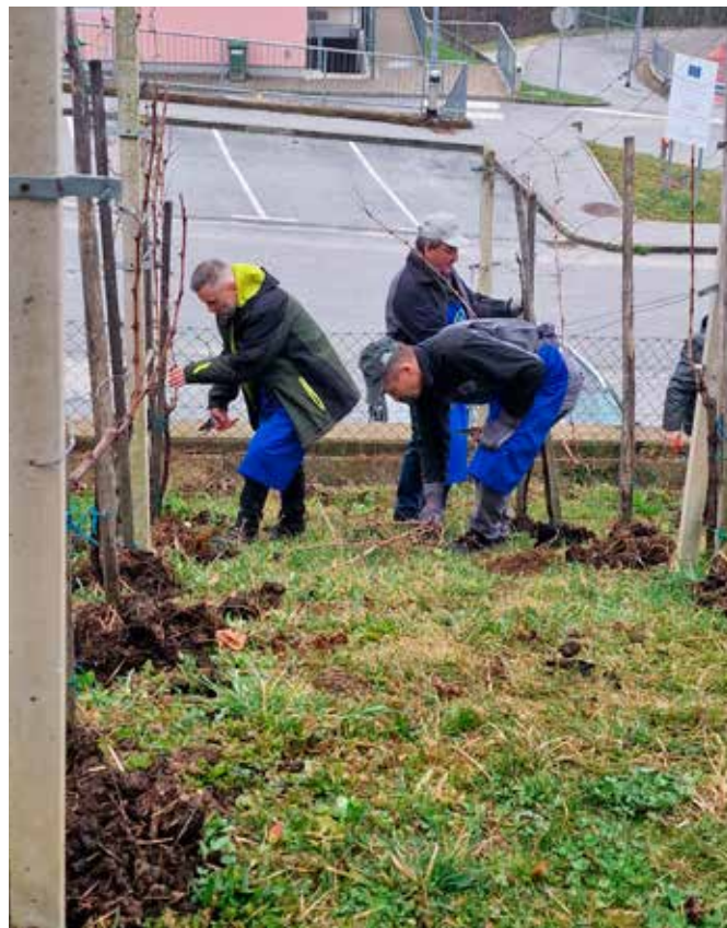
Pripravila: Špela Pokeržnik

Zbrani so dogodek zaokrožili s prijetnim druženjem in domačimi dobrotami za pod zob!