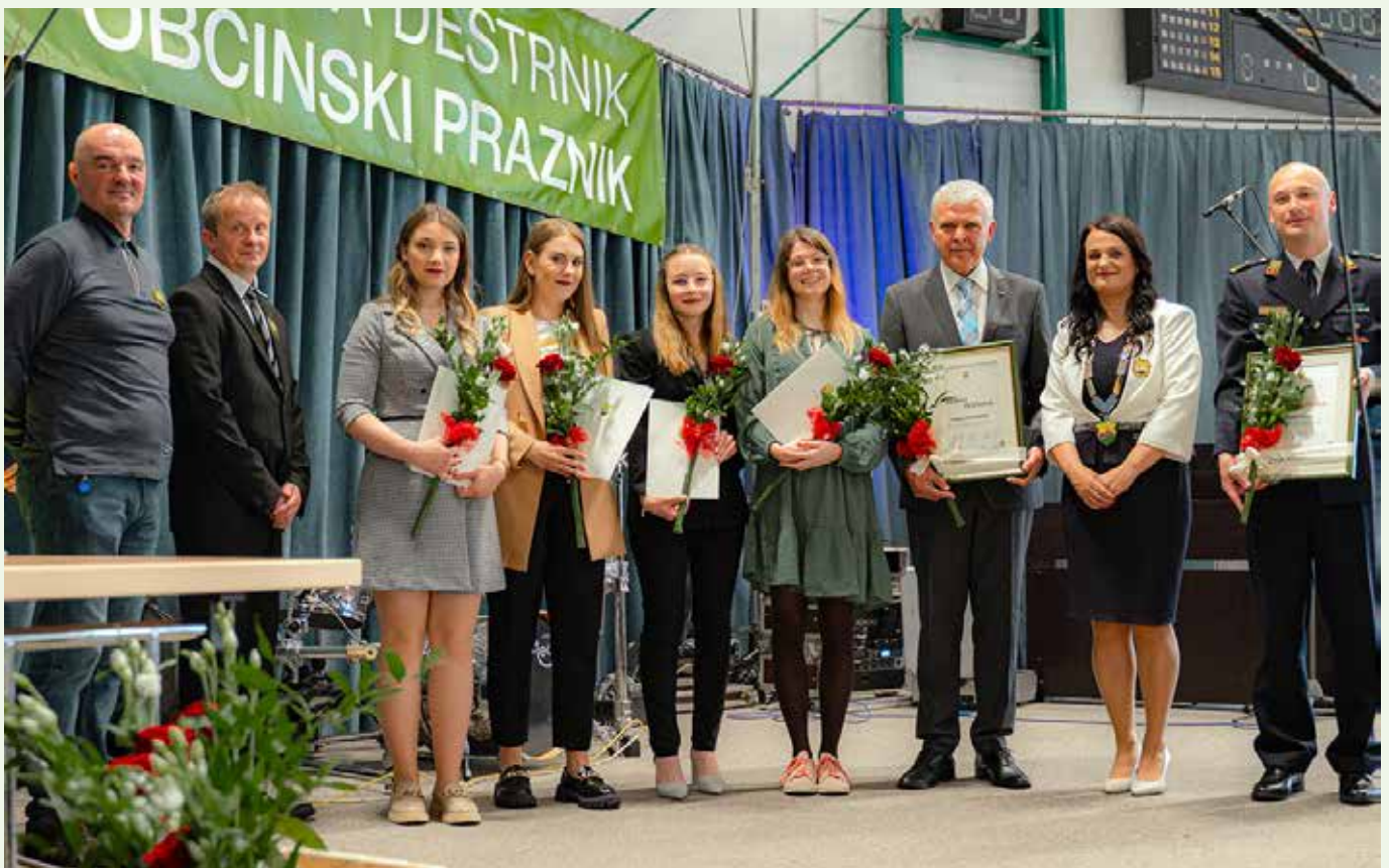
Na fotografiji prejemniki priznanj Občine Destrnik za leto 2023

Komisija za odlikovanja in priznanja Občine Destrnik