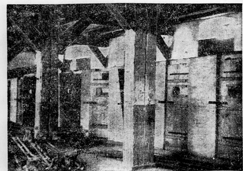
Celice v rizarni, kjer so zapirali, mučili in sezgali svobodoljubne Tržacane

Obtoženi Rainer je bil nato zaslišan o svojem nacističnem delovanju pred »anslusom«, kjer je organiziral prevzem oblasti na Dunaju in v ostalih deželah Avstrije. Oblast so nacisti prevzeli brez vsakršnega odpora. — Nato je obtoženc opisal poskuse Himmlerja, da bi stopil za časa vojne v stik z Anglijo. Dejal je: »Himmlerja je že več mesecev opozarjal šef urada VI. Schellenberg, da bi bilo dobro, vzpostaviti zvezo z Anglijo. Schellenberg mu je izjavil, da ima on — Himmler — pri Angležih določene izgled, ker je znan kot človek železne roke, ki bi edini lahko preprečil zmedo in