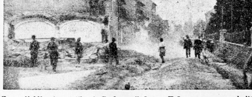
Znana ljubljanska gostilna iz Prešernovih časov »Krcna« se mora umakniti novi široki cesti Ljubljana—Trst

padla za 23.995.— Din, Viden padeč te prilagoditve zbirke je v okrajih: Ljubljana—mesto, Trbovlje, Skofja Loka, Ljubljana—okolica, Mozirje, Konjice, Grosuplje, Krško in Novo mesto.