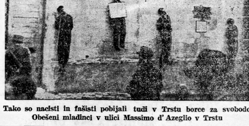
Tako so nacisti in fašisti pobijali tudi v Trstu borce za svobodo Obešeni mladinci v ulici Massimo d'Azeglio v Trstu

Sodna razprava se bo nadaljevala jutri ob 7.