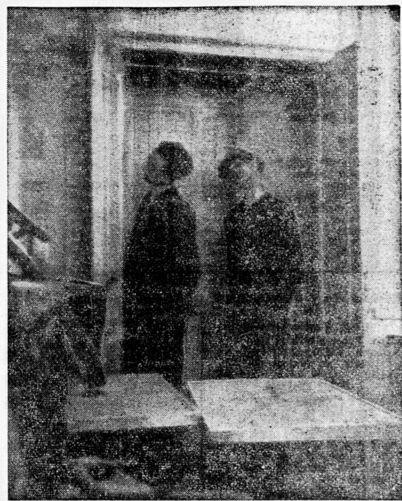
Nacifašisti so obešali antifašiste v Trstu v omarah njihovih stanovanj