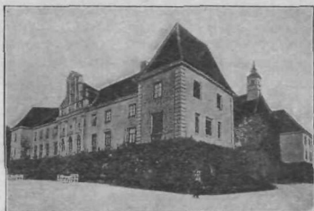
Grad grofa Szaparyja v Murški Soboti.

Kakor v skoro vsakem kraju na Madžarskem, tako je tudi tu krašen, velikanski grad grofa Szaparyja z razkošnim parkom. Ogleдали smo si vse notranje prostore, za kar smo rabili nekoliko ur. Grad je poln starinskih dragocenosti, v opravi pa kaže znake razkošnega življenja madžarske grofovske rodovine. Grof živi v inozemstvu. Grad je pod državnim sekvestrom, park je odprto izprehajališče za meščane. Prej je bilo navadnim ljudem zabranjeno stopiti v park.