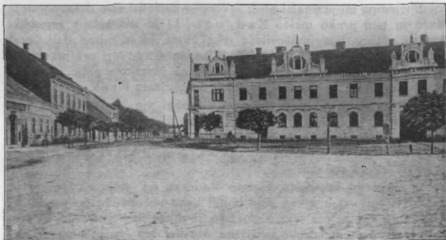
Murska Sobota; Aleksandrova cesta.

Hodili smo eno uro med samim rodovitnim poljem, nikjer nobena drevesa več, nikjer vasi. Šli smo še dve uri — še po samoti, po veliki ravnici. Samo tam daleč ob Muri smo videli cigansko vas. Ti cigani, ki so prej živeli od plenitve in kraje, so se vendar začeli nekoliko pečati s poljedelstvom. — Sama samota. Kako drugačen je značaj te pokrajine od značaja sosednjih Slovenskih goric: tam obljudenost, veselje, delo, vino — tu samota, neka turobna tišina, jako redke vasi. — To je napravila stoletna nasilna državna delitev v istem narodu.