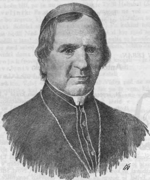
Antonius Martinus Slomšček • 1800 • 1862

Anton Martin Slomšek je bil imeniten učitelj, pesnik in pisatelj. O njem ve skoraj vsa naša šolska mladina marsikaj povedati, česar