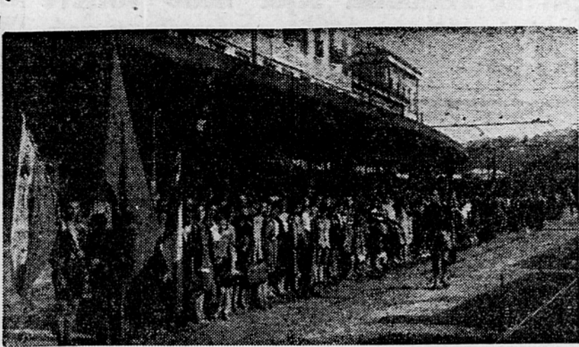
Tržaška mladina pred odhodom iz Postojne

Vojaška godba je zaigrala himno »Hej Slovanci«, nakar se je podajala mladina na večerjo. Po večerji je bila na igrišču II. brigade Narodne obrambe sinfonijski koncert. Udeležila se ga je vsa mladina iz Trsta, kakor tudi mladina iz Postojne in okolice. Prišlo je ogromno število prebivalstva