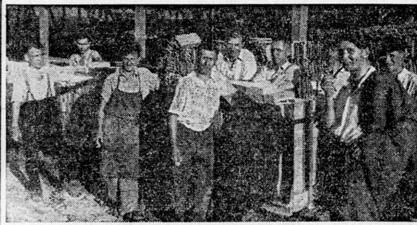
Ljubljanski poštni uslužbenci na karnah na Brdu

Tudi Združene opekarne na Brdu pri Ljubljani so v polnem razmahu za obnovo naše porušene domovine. Da bi bili po okupatorju uničen domovi čim prej obnovljeni, so se 120 stalnih delavcem pridružili se ljubljanski poštni nameščenci. Za delo so vsi krepko in resno poprijeli in delajo sleherni dan od 15. do 18. ure v skupnari po 30 oseb. Čeprav niso vajeni takega dela, jim gre vendar uspešno izpod rok. Saj delajo z veseljem in podrti z željo, da tudi oni pripomorejo kar največ pri obnovi domovine. Dogovorjeni so, da bodo plačilo ob zaključku dela poklonili