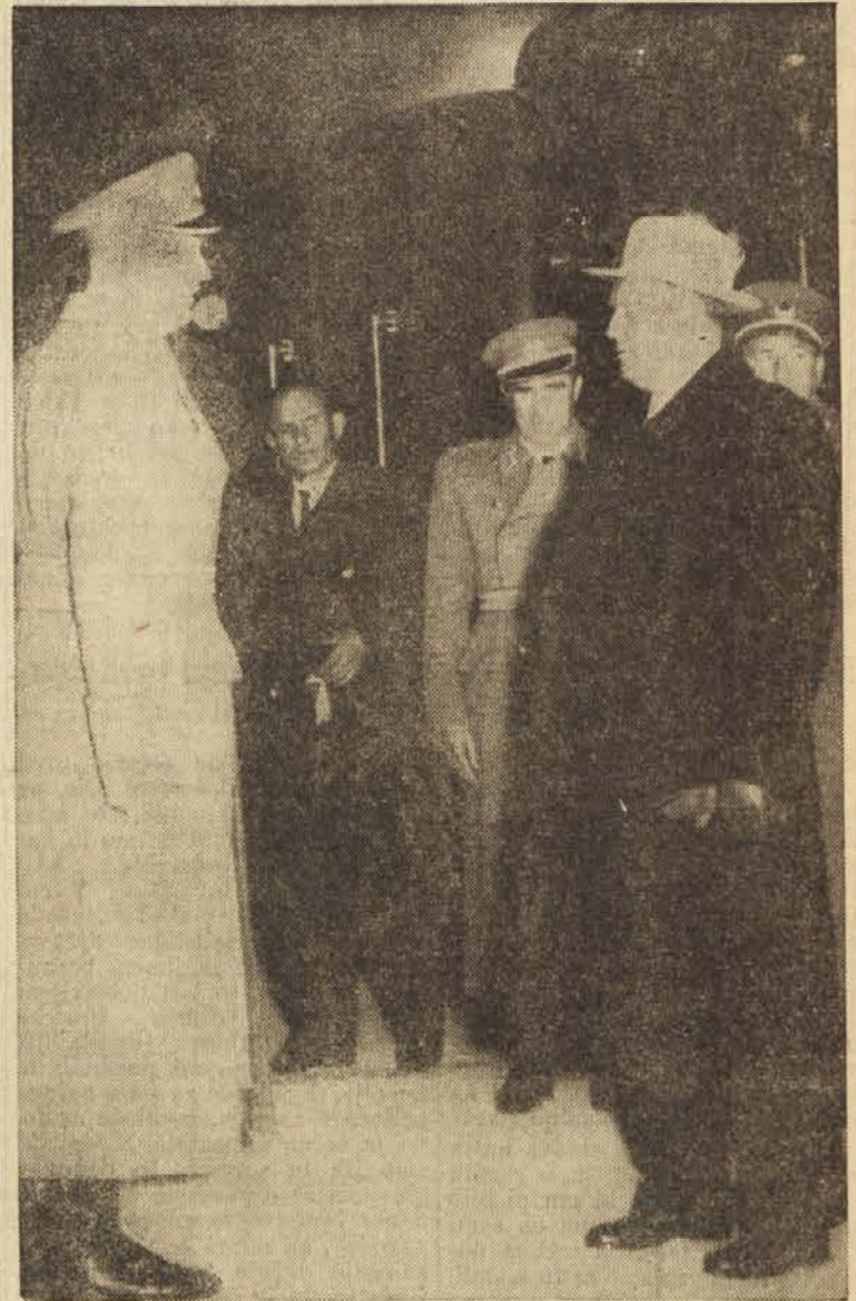
Maršal Tito sprejema na postaji v Sarajevu raport poveljnika častne čete

Jajce, 1. dec. (Tanjug). — Na svečanem kosilu, ki so ga priredili v nedeljo v Jajcu na čast predsednika republike, so predstavniki Jajca izročili maršalu Titu darila. Predsednik republike se je zanje toplo zahvalil in ob tej priliki podaril Domu vojnih sirot v Jajcu 300.000 din.