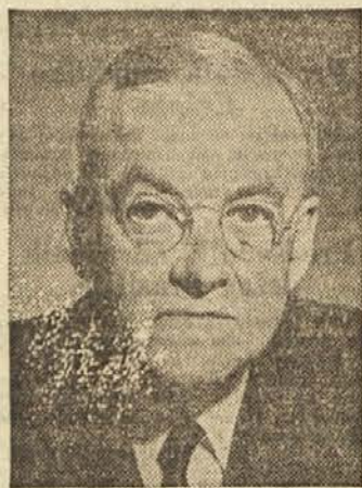
John Foster Dulles

Ali bodo na Bermudih odgovorni politiki tako za Zahod kakor tudi v odnosu do Vzhoda pripravljeni in voljni izkrciti pot do tega cilja? Bermudi bodo vsekakor dali vsaj delni odgovor na to