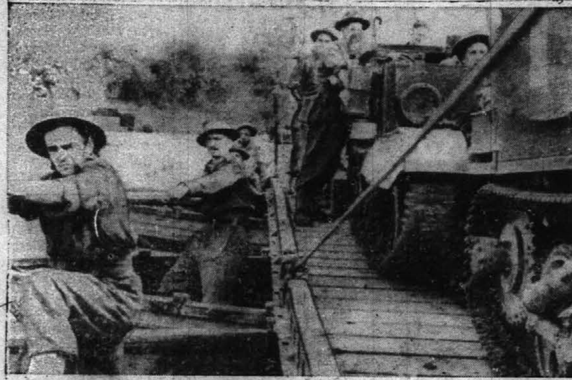
Po radiu poslana slika, ki kaže, kako britiški armadni inženirji veslajo prek reke Voltorno blizu kraja Castello Voltorno, v Italiji. Te vrste brod, ki so ga naredili, imenujejo "shore landing deckcraft". Na njem peljejo čez reko ojačenja, nosilce, municijo in živež.