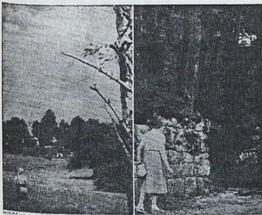
Sv. Miklavž in izvir „Gospodične“ v Gorjancih“