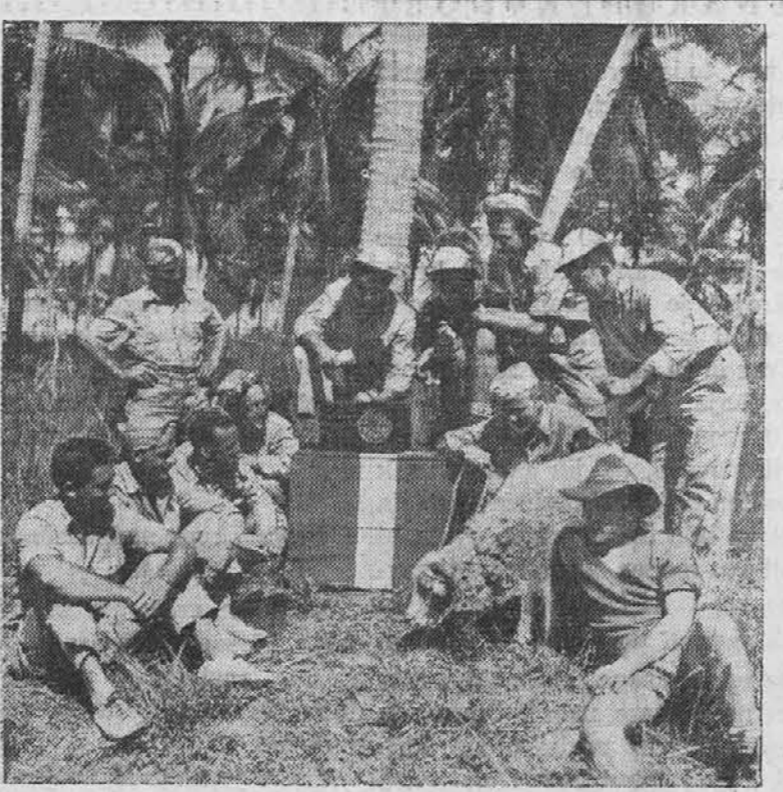
HOME IN THE JUNGLE.—U. S. soldiers, somewhere in Australia, take time out from fighting to listen to one of their favorite American radio programs. These shortwave programs are made possible through the efforts of the American Red Cross, the Office of War Information and the Special Services Branch of the Army.

In dan je minil za dnevom, ali pravega razpoloženja ni bilo za Jerico. Čutila je, da ni najmanjšega razločka mej njo in umirajočo naravo, in skoro želela si je nekaj posebnega,