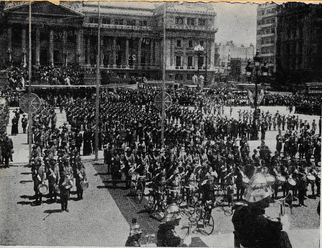
Nastop salezijanskih katoliških skavtov pred parlamentom v Buenos Airesu.

da je bila vsemu temu novomašnemu veselju primešana tudi kaplja grenkosti: ob novomašnikovi strani ni bilo tiste, ki si je najbolj želela, da bi ga videla pri oltarju, matere. Zato so