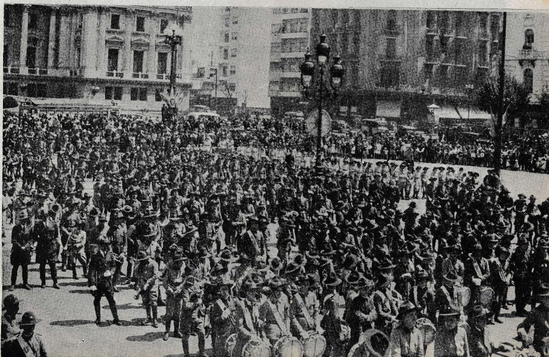
Buenos Aires: Pogled na skupino salezijanskih katoliških skavtov.

Živahnega udejstvovanja v gledališču se pa skoraj opisati ne da. Pri naših burkah se nasmejete, da mehovi za smeh, ki so za take prilike vedno naročeni, obupno odpovedo. Ne smemo pa prezreti uspehov, ki so si jih pridobili igralci resnih iger, ob katerih te zgrabi za srce, da ti stopi solza v oči, v duši ti pa postane mehko in nehote se ti porodi trden in odločen