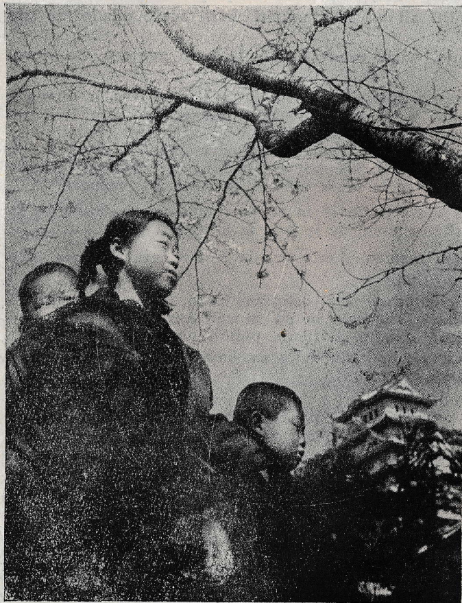
Pod cvetočo češnjo na Japonskem.

Kadar Bog da krščanskim staršem otroka, se zdi, kakor da jim ponavlja to, kar je Faraonova hči rekla Mojzesovi materi: „Vzemi tega otroka in mi ga vzredi!“ Po božji zamisli so starši prvi vzgojitelji svojih otrok. Vendar pa je treba priznati, da jih v sedanjih družabnih prilikah skrb za vsakdanji kruh resno ovira pri izpolnjevanju te bistvene dolžnosti. V podobnih razmerah je tudi mladi Janez Bosko že delal načrte, kako bi pomagal staršem pri njihovi težki nalogi. Da ga je Previdnost res pripravljala za to poslanstvo, je njegovo srce že zgodaj slutilo. Že v devetem letu je imel preroške sanje, v katerih je gledal, kako so se divje živali spremenjale v krotka jagnjeta. Da spoznamo, kako je uvajal v življenje to, česar se je bil v sanjah naučil, si moramo poklicati v spomin, kako je bil vzgojen in kako