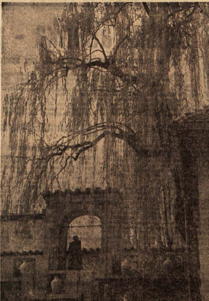
LJUBLJANA SE PONAŠA S ŠTEVILNIMI DELI POKOJNEGA JOZETA PLEČNIKA ~ KRIZANKE