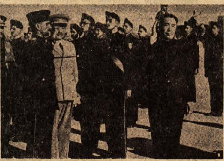
Kitajski ministrski predsednik Ču En Laj je ob svojem zadnjem obisku v Indiji pregledal tudi nekatere oddelke indijskih orožnih sil. Na sliki pri pregledu gojencev višje oficirske šole v New Delhiju

Predstavniki ameriške delegacije v OZN je takoj po objavi poročila Daga Hamarskjölda izjavil, da se je ameriška delegacija že začela posvetovati z ostalimi delegacijami o ustanovitvi predlaganega odbora. Do naslednjega zasedanja Skupščine konec tega tedna bi utegnili dobiti ameriška delegacija podporo 20 ali več delegacij.