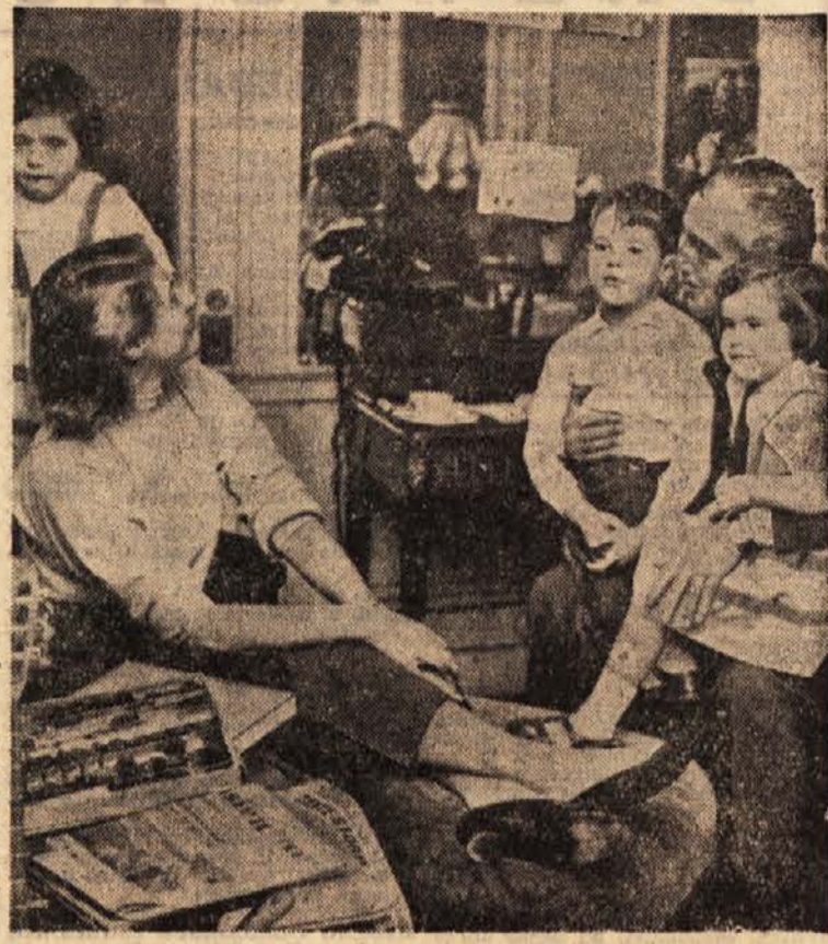
Med nedavnim bivanjem v Parizu je obiskal znani italijanski režiser in igralec Vittorio de Sica Ingrid Bergmanovo, ki se je prav tedaj pripravljala na premiero »Pariškega gledališča«, ter se dal slikati v družbi njenih otrok.

Ko sva s prijateljem odhajala, sva srečala žensko, ki sta ji dva delavca pomagala riniti modro limuzino proti zastavljalnici in izposojevalnici motornih vozil. Hotela sva jo posvariti, pa jo je nameščenec že videl in ji je na tihem gotovo že odtgnil 10.000 frankov. -ps.