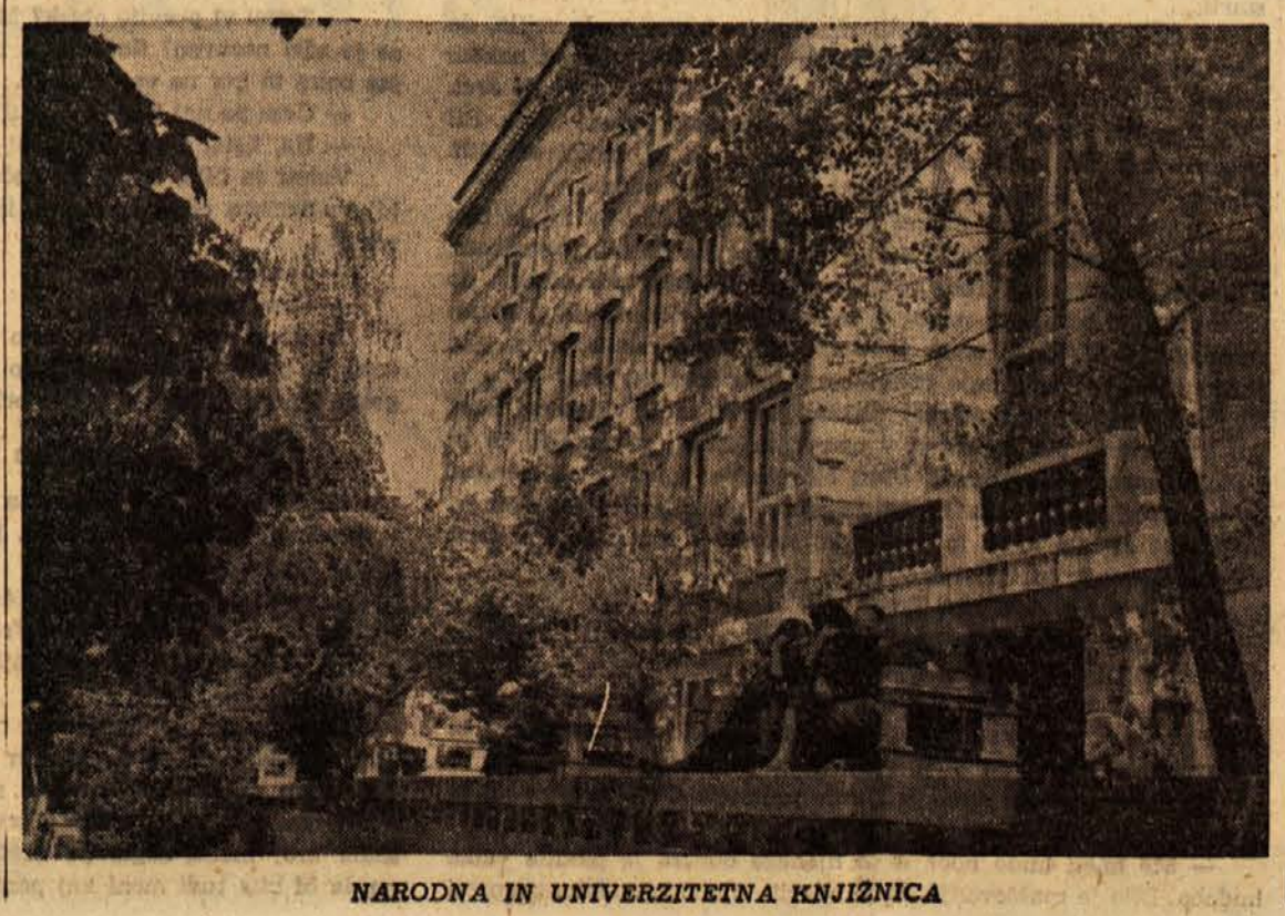
NARODNA IN UNIVERZITETNA KNJIŽNICA